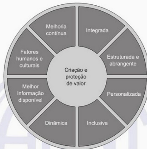
Figura 2 – Princípios

Os princípios descritos na Figura 2 fornecem orientações sobre as características da gestão de riscos eficaz e eficiente, comunicando seu valor e explicando sua intenção e propósito. Os princípios são a base para gerenciar riscos e convém que sejam considerados quando se estabelecerem a estrutura e os processos de gestão de riscos da organização. Convém que estes princípios possibilitem uma organização a gerenciar os efeitos da incerteza nos seus objetivos.