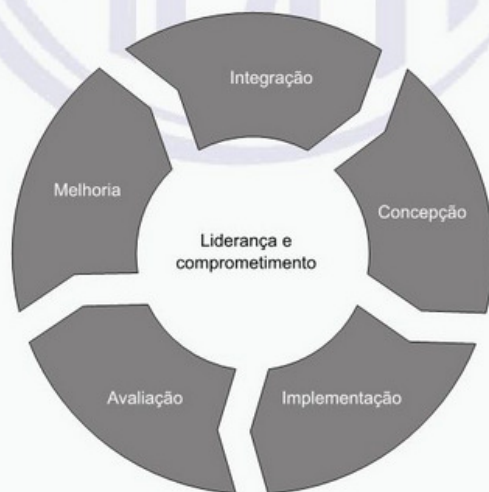
Figura 3 – Estrutura

O desenvolvimento da estrutura engloba integração, concepção, implementação, avaliação e melhoria da gestão de riscos através da organização. A Figura 3 ilustra os componentes de uma estrutura.