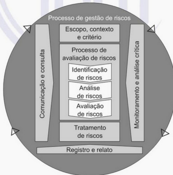
Figura 4 – Processo

O processo de gestão de riscos envolve a aplicação sistemática de políticas, procedimentos e práticas para as atividades de comunicação e consulta, estabelecimento do contexto e avaliação, tratamento, monitoramento, análise crítica, registro e relato de riscos. Este processo é ilustrado na Figura 4.