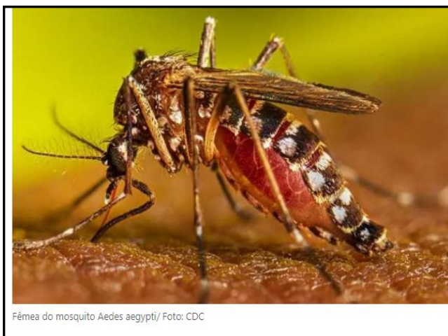
Fêmea do mosquito Aedes aegypti

Um menino de 17 anos que prestava serviço militar em Puerto Suárez é o afetado. Ele foi transferido para a capital de Santa Cruz, devido a complicações de saúde.