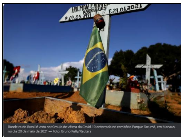
Bandeira do Brasil é vista no túmulo de vítima da Covid-19 enterrada no cemitério Parque Tarumã, em Manaus, no dia 20 de maio de 2021

Em outubro de 2021, o país atingiu 600 mil mortes por Covid.