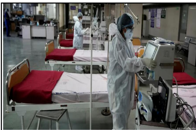
Hospitais foram instruídos a realizar em abril simulações para garantir a prontidão operacional da infraestrutura médica

Casos diários no país asiático pulam de 100 em janeiro para mais de 1.500. Especialistas afirmam que cepa XBB.1.16, da família da ômicron, é mais contagiosa, mas não há indícios de que leve a maior gravidade da doença.