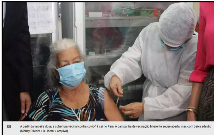
A partir da terceira dose, a cobertura vacinal contra covid-19 cai no Pará. A campanha de vacinação bivalente segue aberta, mas com baixa adesão

O novo boletim InfoGripe indica que, ao todo, 18 estados estão com tendência de aumento do número de casos de síndromes respiratórias agudas graves (SRAG) e a covid-19 se manifestou em quase metade.