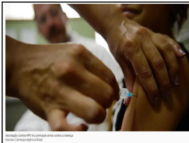
Vacinação contra HPV é a principal arma contra a doença

A região Norte é a que apresenta a menor cobertura vacinal para as duas doses: pouco mais da metade (50,2%) das meninas. Entre os meninos, o percentual fica em 28,1%.