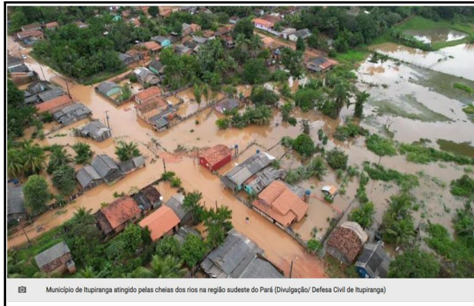
Município de Itupiranga atingido pelas cheias dos rios na região sudeste do Pará

Os municípios de Itupiranga e Água Azul do Norte passaram a integrar a lista nesta sexta-feira (31).