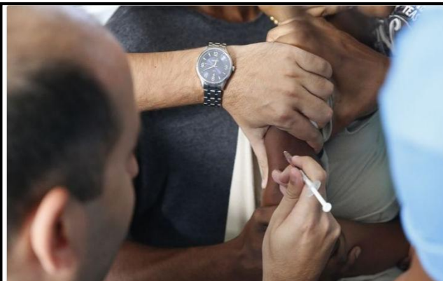
Vacinação contra a pólio tem baixa cobertura em países das Américas

Ministério da Saúde afirmou que não se trata do vírus selvagem, mas de um tipo derivado de vacina, que pode infectar pessoas em áreas com baixa cobertura vacinal.