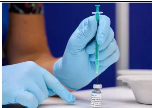
Profissional prepara dose da vacina contra a varíola dos macacos (monkeypox)

Imunização contra doença antes conhecida como 'varíola dos macacos' focará tanto em pessoas que tiveram exposição ao vírus quanto nas que não tiveram diagnóstico da doença, mas têm risco de desenvolver formas graves da enfermidade.