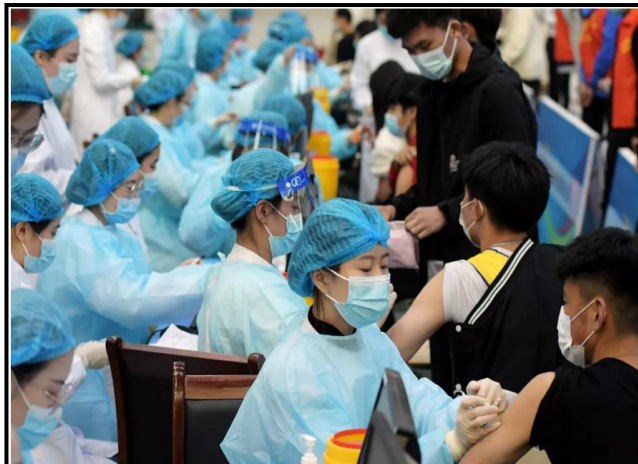
Profissionais de saúde aplicam vacinas em estudantes em Qingdao, na China, em 2021.

Até agora, Pequim não havia aprovado nenhuma vacina com a tecnologia do RNA mensageiro, como a da Pfizer e da Moderna.