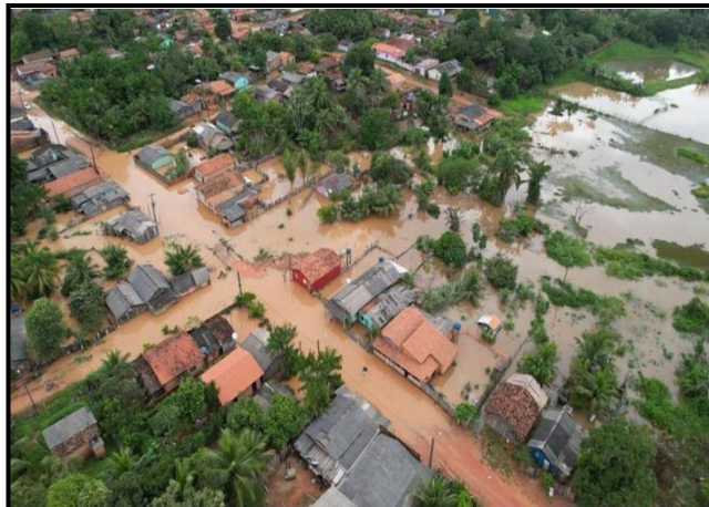
Município de Itupiranga atingido pelas cheias dos rios na região sudeste do Pará

O rio Tocantins está 11,24 metros e o rio Itacaiúnas, 13,26 metros acima do considerado normal. Diante do episódio, as Prefeituras decretaram situação de emergência nas cidades, onde muitas famílias estão desabrigadas devido à enchente