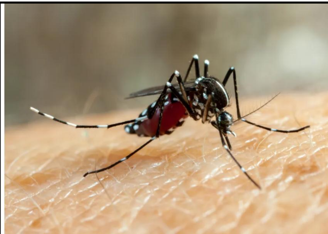
O mosquito africano Aedes aegypti é o transmissor da dengue, ou melhor, a fêmea do mosquito

Até a última semana, mais de 400 mil casos prováveis de dengue foram registrados no Brasil. A taxa representa um aumento de mais de 53% em comparação ao mesmo período do ano passado. Números da chikungunya também preocupam.