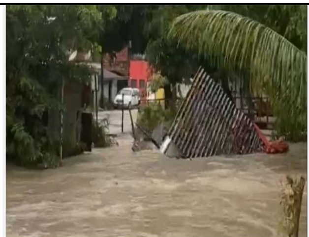
Não há informações se havia pessoas dentro das casas no momento da tragédia, e nem se há feridos

Só em Rio Branco (AC), mais de 2.500 pessoas ficaram desalojadas ou desabrigadas, enquanto em Manaus (AM), vídeo mostra muro sendo destruído. Cidades de Tocantins, Pará e Rondônia também foram afetadas.