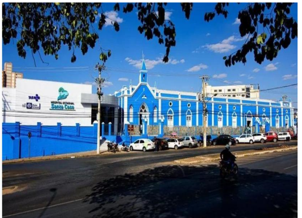
Hospital Estadual Santa Casa em Cuiabá, no Mato Grosso

Pacientes chegaram ao Hospital Estadual Santa Casa infectados pela bactéria resistente Klebsiella Pneumoniae Carbapenemase (KPC), de acordo com a Secretaria Estadual de Saúde