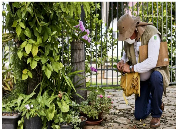
Assim como a dengue e a Zika, a chikungunya é transmitida pelo mosquito Aedes aegypti .

Os maiores percentuais de aumento foram observados na região Sudeste, com destaque para os estados de Minas Gerais e Espírito Santo.