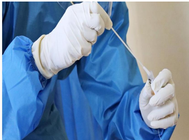
De acordo com a última atualização da OMS, foram confirmados mais de 760 milhões casos da doença e cerca de 6,8 milhões mortes acumuladas.

Os dados apontam que a variante Ômicron se tornou predominante no mundo e está presente em 98% das sequencias genéticas.