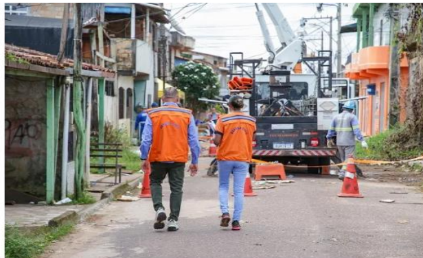
Cresce área de risco em região de Abaetetuba que sofreu deslizamentos

'Algumas pessoas não entenderam ainda qual é a gravidade. Por isso a necessidade da evacuação total', explica coordenador da Defesa Civil Municipal.