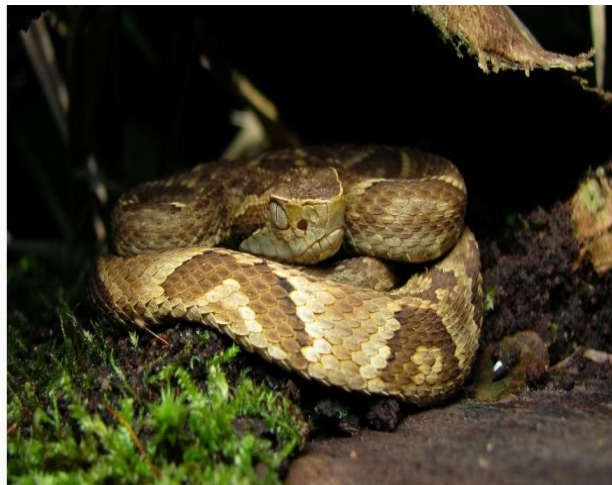
Picada de cobra é muito dolorosa e, caso a serpente seja venenosa, a preocupação sobre os riscos aumenta

No Brasil, foram registrados em 2020 nos sistemas oficiais do Ministério da Saúde 31.395 acidentes com serpentes, dos quais 121 foram fatais.