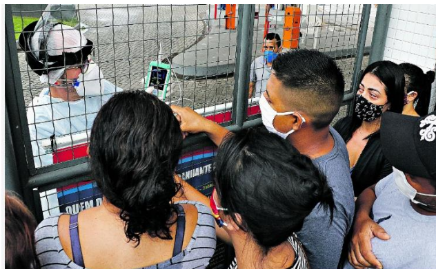
Há três anos o Estado começava sua luta contra o coronavírus, que ceifou a vida de mais de 19 mil paraenses de 2020 até os dias de hoje

Era um 18 de março de 2020 quando a Sespa confirmou o primeiro caso de covid-19 no Pará. E como em todo planeta, o Estado teve de adotar restrições duras para salvaguardar a vida de todos.