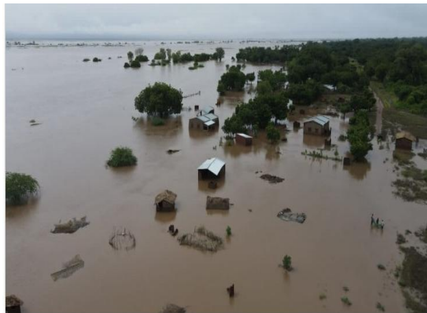
Essas imagens aéreas foram capturadas em 16 de março de 2023, em Nsanje, por um drone da Cruz Vermelha do Malawi.