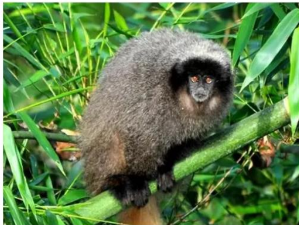
Macaco sauí

O corpo do animal foi localizado por um morador na zona rural do município, no distrito de São Roque da Fartura, no dia 24 de fevereiro. Prefeitura já havia intensificado vacinação desde fevereiro.