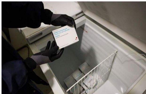
A Sespa anunciará o recebimento das doses na reunião da Comissão Intergestores Bipartite (CIB), que ocorrerá na sede da Secretaria, em Belém, na tarde desta quinta-feira (16).

Serão vacinados grupos prioritários elegíveis, já que a vacina será ministrada em duas doses (D1 e D2), com intervalo mínimo de 28 dias, sendo indicada para uso em profilaxia pré e pós-exposição ao vírus.