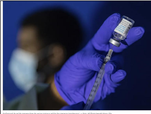
Profissional de saúde prepara dose da vacina contra a varíola dos macacos (monkeypox).

Imunização contra a mpox, doença antigamente conhecida como 'varíola dos macacos', focará em grupos de risco para as formas graves da doença e profissionais de laboratórios. Brasil tem 46 mil doses.