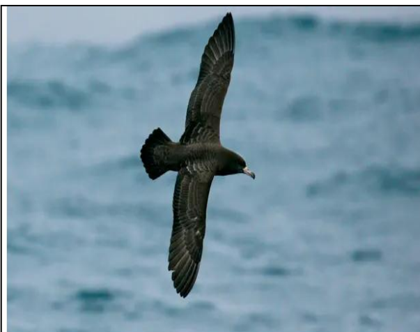
Os cientistas estudaram cagarros e descobriram que a inflamação causada pelo plástico afetou a digestão, o crescimento e a sobrevivência.

Cientistas do Museu de História Natural dizem que a plasticose, que causa cicatrizes no trato digestivo, provavelmente afeta outros tipos de pássaros também