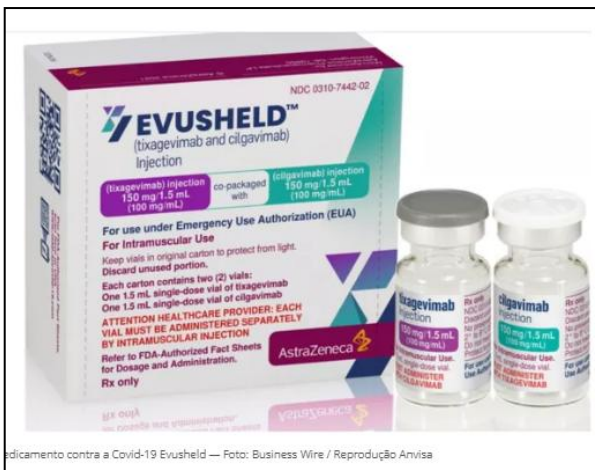
Medicamento contra a Covid-19 Evusheld — Foto: Business Wire / Reprodução Anvisa

Remédio foi o primeiro com indicação profilática autorizado no país, em 2022. Medicamento teve 'queda significativa' na sua eficácia contra variantes de preocupação do coronavírus no Brasil.