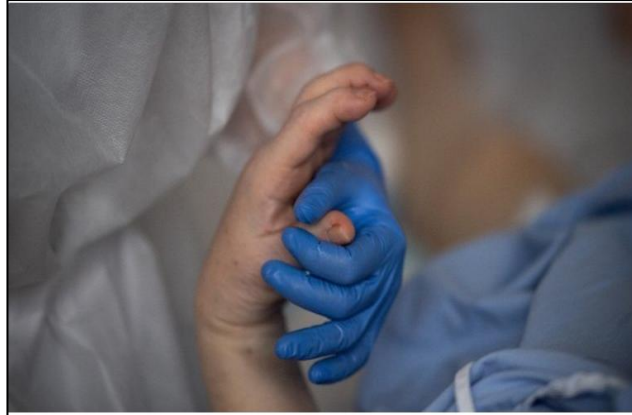
Internações por Covid estão aumentando entre a população adulta - 20.04.2021

Boletim mostra que 18 das 27 unidades da federação registraram mais hospitalizações na semana de 26 de fevereiro a 4 de março