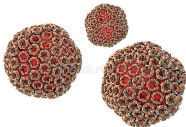
Virus Da Febre De Vale Do Rift

Nove casos em subcondado, Rwanyamahembe, distrito de Mbarara, Um caso em Nyakayojo, cidade de Mbarara ligado ao matadouro da cidade de Mbarara, um caso no distrito de Isingiro e um caso caso no distrito de Kazo.