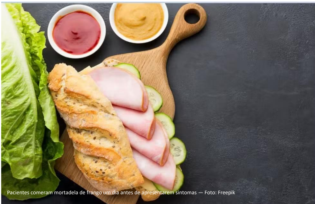
Pacientes comeram mortadela de frango um dia antes de apresentarem sintomas

A TV Bahia conversou com a médica infectologista Clarissa Cerqueira para esclarecer o status de surto na Bahia e a relação da doença com o consumo de mortadela de frango. De acordo com a profissional, o número de ocorrências foge do padrão.