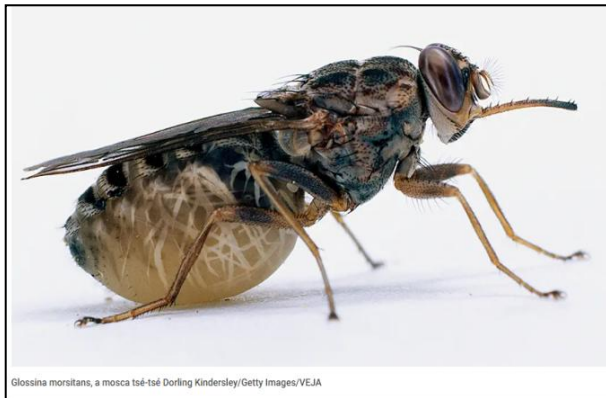
Glossina morsitans, a mosca tsé-tsé

Isso eleva para três o número de Doenças Tropicais Negligenciadas (DTNs) que o país eliminou por meio de esforços colaborativos com parceiros.