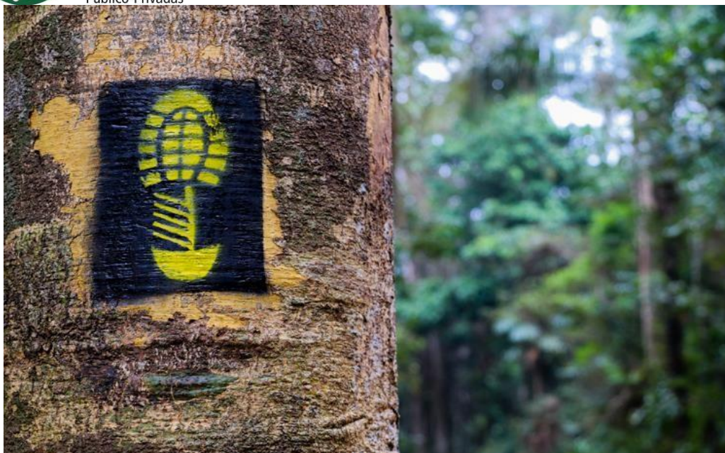
Figura 2 - Marca da Trilha Chico Mendes: O corte da seringueira e o coletor de látex que simboliza a história de resistência e bravura de um povo que resitiu, resiste e inspira a história do socioambientalismo mundial.