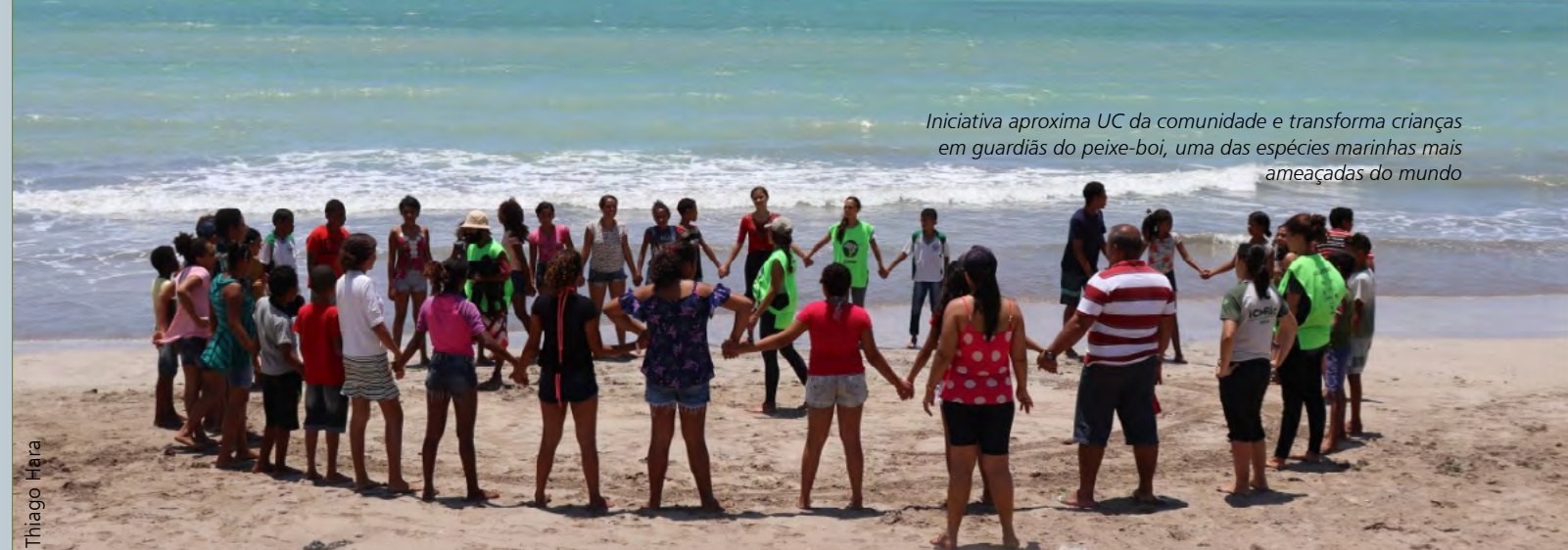
Iniciativa aproxima UC da comunidade e transforma crianças em guardiãs do peixe-boi, uma das espécies marinhas mais ameaçadas do mundo