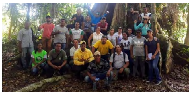
Curso promovido pela unidade capacitou 25 condutores de visitantes

Em novembro, o Parque Nacional (Parna) do Descobrimento (BA), promoveu o primeiro curso de capacitação de condutores de visitantes. O curso foi realizado com apoio da Coordenação Geral de Uso Público e Negócios (CGEUP/Diman) e do Projeto PNUD.