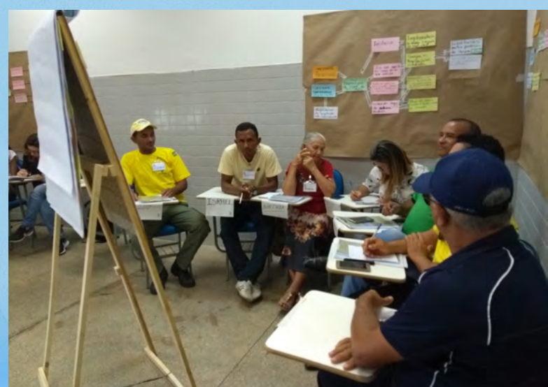
Oficina para Plano de Manejo de Parna e APA teve contribuições de diversos atores locais