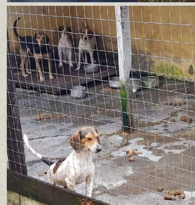
Operação conjunta desmanchou organização criminosa que abatia semanalmente dezenas de animais silvestres