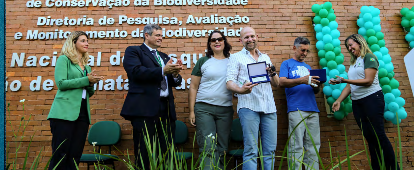
Equipe do CPB ganha nova sede que fica dentro da Flona Restinga de Cabedelo

Nacional de Pesquisa e Monitoramento da Biodiversidade