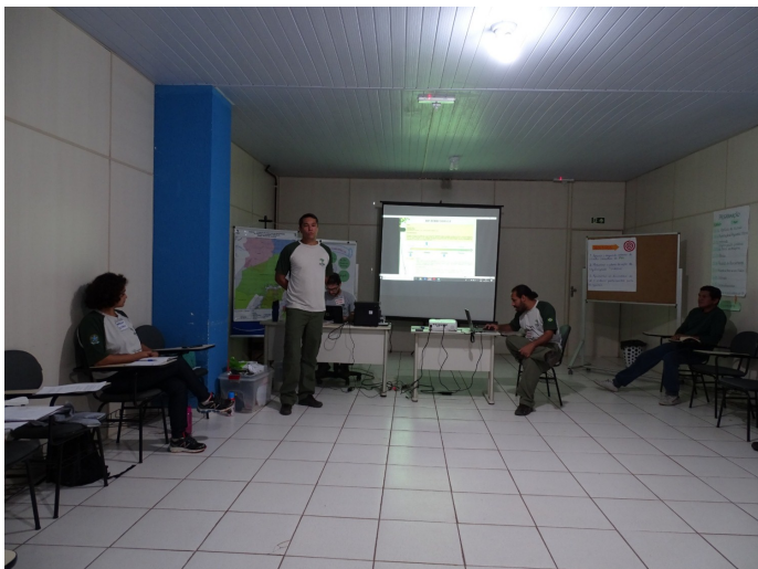
Figura 3. Apresentação sobre o processo de regularização fundiária no Parna da Amazônia

Ao longo de toda a apresentação, os conselheiros puderam apresentar questionamentos e solicitar esclarecimentos quanto ao andamento do processo de regularização fundiária do Parna da Amazônia.