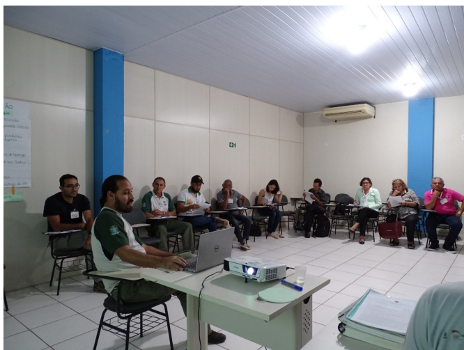
Figura 2. Apresentação e consolidação do regimento interno do conselho consultivo do Parna da Amazônia.