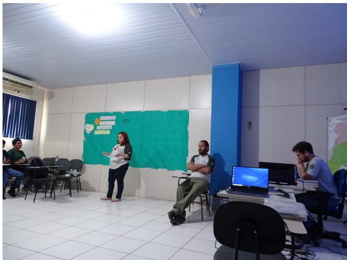
Figura 4. Apresentação sobre planejamento e instrumentos de gestão de unidades de conservação

Considerando a previsão de realização das oficinas de revisão do plano de manejo e do plano de uso público do Parna da Amazônia, o conselho realizou mapeamento de instituições estratégicas a serem convidadas para participar destas oficinas. A lista das instituições indicadas encontra-se descrita no quadro 2.