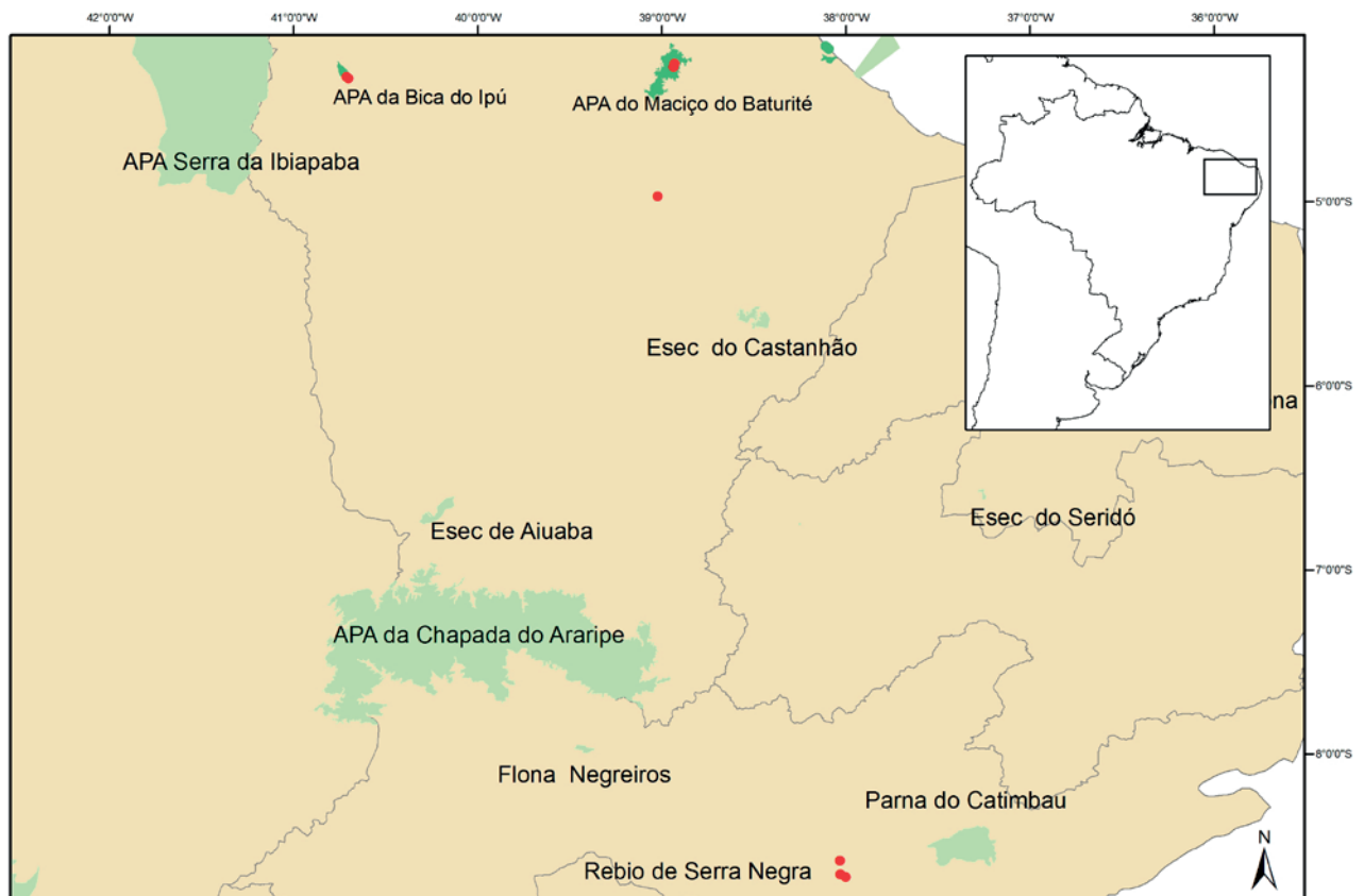
Mapa 2 - DISTRIBUIÇÃO DO PERIQUITO-CARA-SUJA