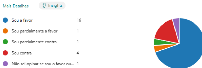
Figura 4. Opinião dos respondentes sobre o projeto de permissão do sobrevoio panorâmico no Parque Nacional do Iguazu.

A planilha em anexo apresenta, excluído os dados pessoais dos contribuintes, as manifestações individuais de cada participante e as respostas institucionais que se fizeram necessárias.