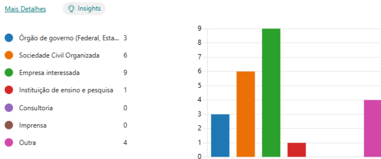
Figura 2. Setor de atuação do responsável pela contribuição ao formulário de consulta pública do projeto de permissão do sobrevoio panorâmico no Parque Nacional do Iguazu.