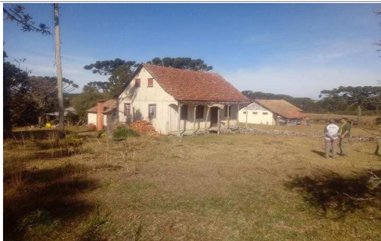
Casa da Noiva em primeiro plano e casa da Macieira em segundo