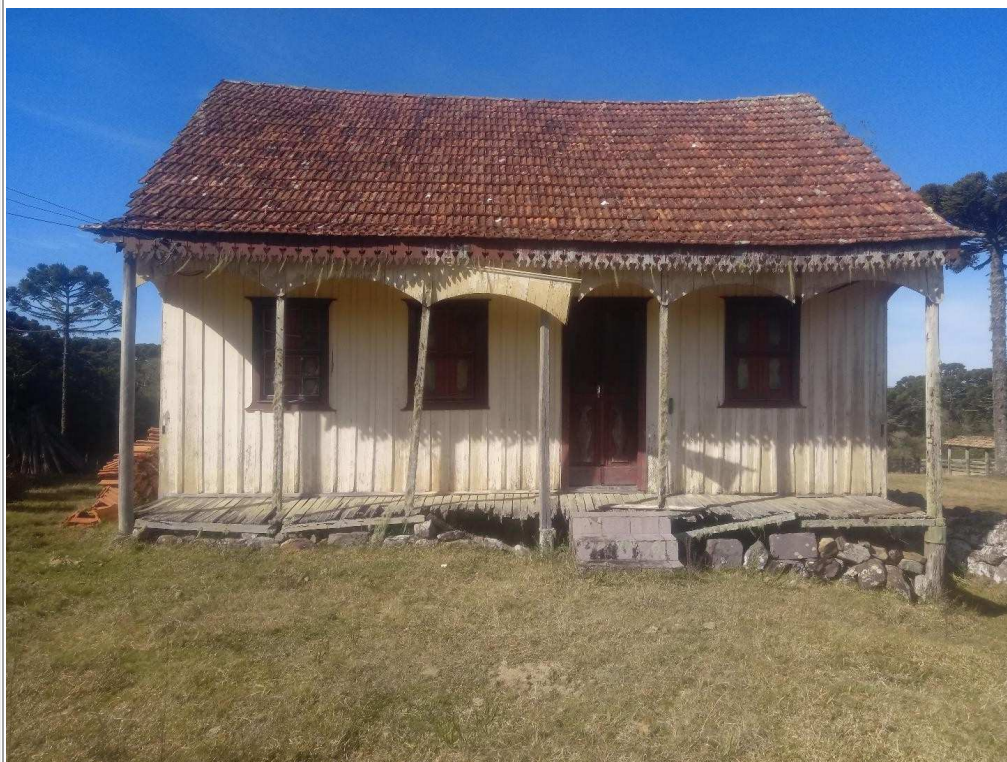
Casa da Noiva