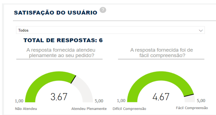
Fig.2 – Satisfação do Usuário. Painel de Acesso à Informação, 2023.

Para as 6 respostas à pesquisa de satisfação do usuário recebidas em 2023, o Ibict obteve nota de 3,67 para a pergunta “a resposta fornecida atendeu plenamente ao seu pedido? ”, e nota de 4,67 para a pergunta “a resposta fornecida foi de fácil compreensão? ”, conforme o gráfico abaixo: