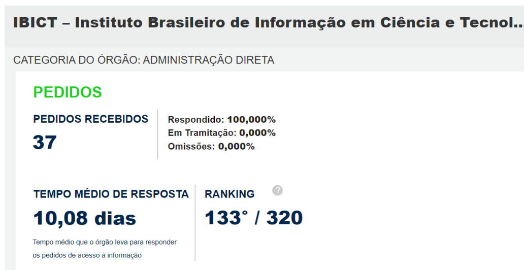
Fig.1 – Pedidos recebidos e tempo médio de resposta. Painel de Acesso à Informação, 2023.

O gráfico a seguir apresenta o volume de pedidos recebidos e o tempo médio que o órgão leva para responder esses pedidos: