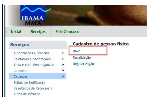
Fig. 02 e 03: Cadastrando o Usuário no CTF (Cadastro Técnico Federal)

1.2. Selecione se o cadastro será feito para pessoa física ou pessoa jurídica (fig. 02);