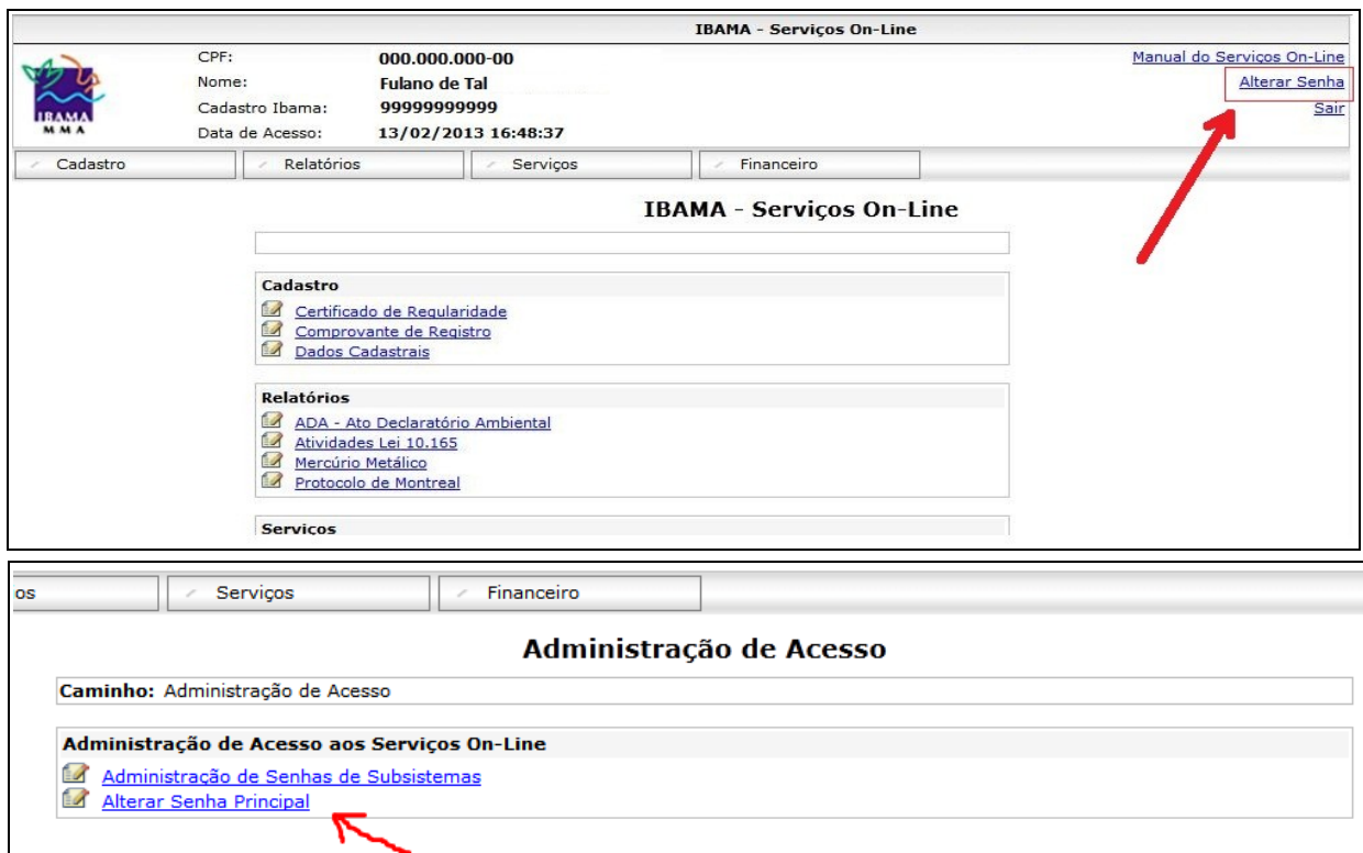
Fig. 06 e 07 – Alteração de senha no sistema principal do CTF.