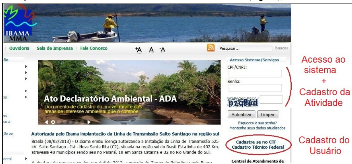
Fig. 01: página inicial do Ibama, mostrando o acesso aos serviços/sistemas em dois momentos: (1) o cadastro de Usuário e (2) o cadastro de Atividades.

1.1. Clique em “ Cadastre-se no CTF - Cadastro Técnico Federal ” (Fig. 01);