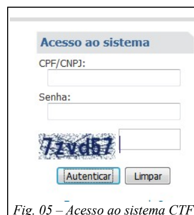
Fig. 05 – Acesso ao sistema CTF