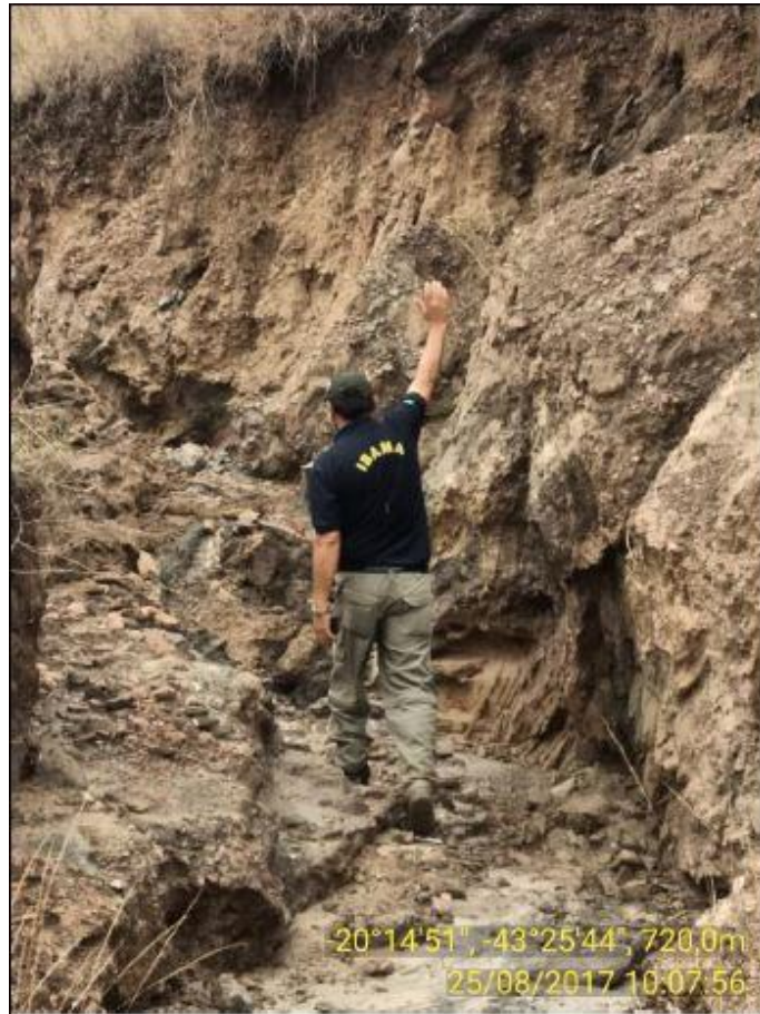
Foto 7. Grupo G4. Ponto ITS08 apresentando erosão do tipo voçoroca, determinante para exigência de medidas corretivas e preparatórias com monitoramento.