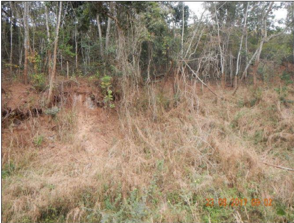
Foto 6. Grupo G3. Ponto ITG28, com trechos que necessitam de intervenções concomitantes ao plantio de mudas.