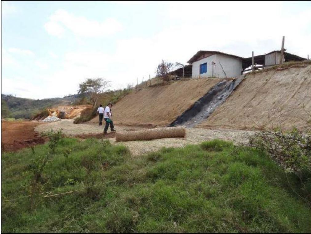
Foto 5. Grupo G3. Ponto ITG66 com trechos que necessitam de intervenções concomitantes ao plantio de mudas florestais.