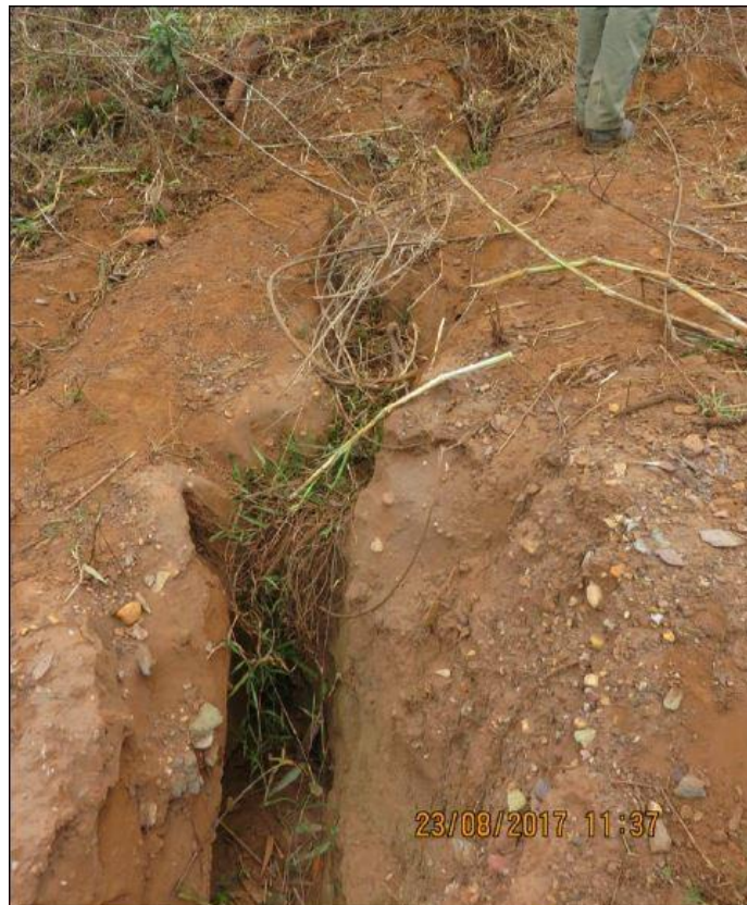
Foto 5. Grupo G4. Ponto ITG30, apresentando erosão do tipo ravinar, determinante para exigência de medidas corretivas e preparatórias com monitoramento.