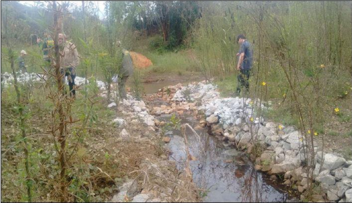
Foto 1. Grupo G1. Ponto ITS15. Não apresenta erosão e vestígios de animais de criação, permitindo o plantio de espécies florestais.