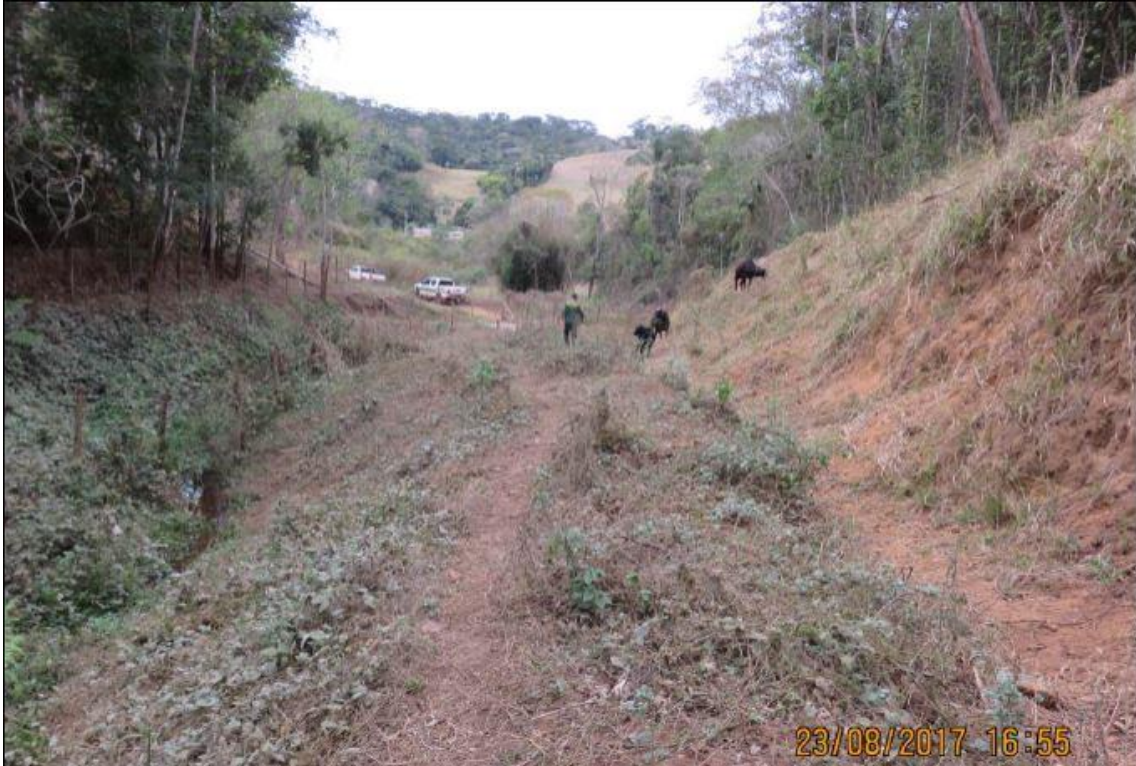
Foto 3. Grupo G2. Ponto ITG49, com a presença de gado bovino, ensejando providências consideradas de baixa complexidade.