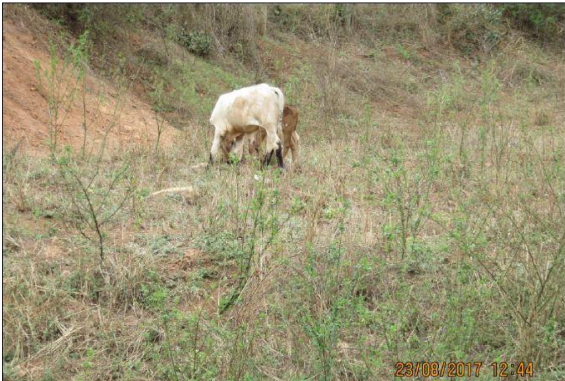
Foto 4. Grupo G2. Gado bovino, animais de criação presentes no ponto ITG29. Ações corretivas de baixa complexidade.