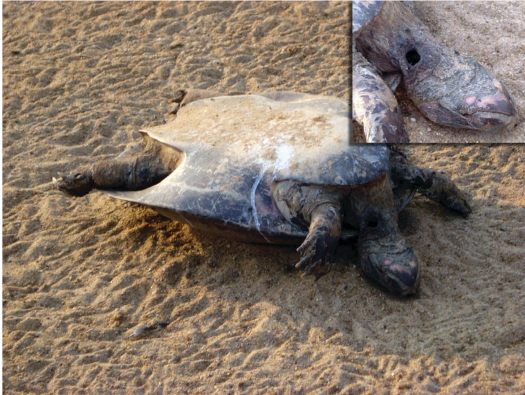
Figura 2. Fêmea adulta de P. expansa predada por P. onca após realizar desova na praia Canguçu, no detalhe marcas do ataque no pescoço da fêmea.

Figure 2. Adult female of P. expansa predated by P. onca after the nesting time in the Canguçu beach, details show the marks of the attack on the female neck.