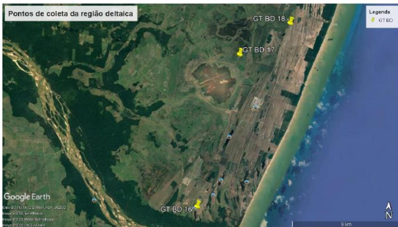
Figura 1- Pontos de coleta no complexo Degredo.