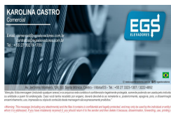
KAROLINA 2019.jpg 93 KB

«Warning: This message (including any attachments) and the files it contains is confidential and legally protected, and may only be used by the individual or entity to whom it is addressed. If you have mistakenly received it, you should return it to the sender and then delete it because, dissemination, forwarding, use, printing or copying of the contents of this screen are expressly prohibited. »