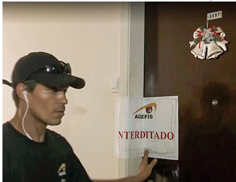
Equipe da Agefis interditou e multou o estabelecimento