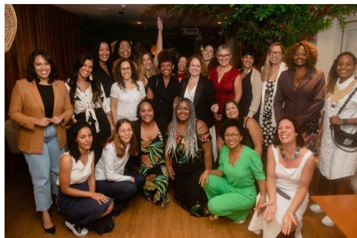
Programa Future Females - UK-BR Tech Hub