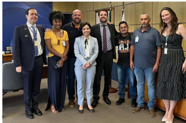
Cooperação com Anatel e sociedade civil em regulação para redes comunitárias