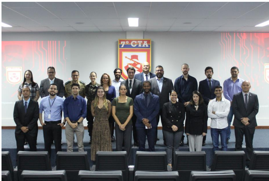
Treinamento OSINT – Inteligência de Fontes Abertas em Cibersegurança