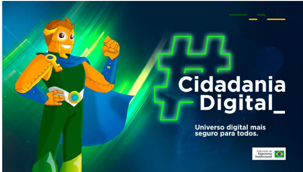
Campanha de conscientização para jovens em boas práticas online