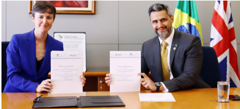
Memorando de Entendimento – Anatel Setembro 2020