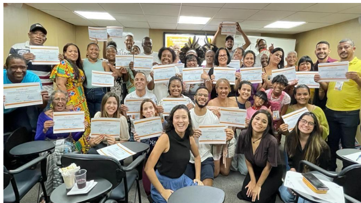
Projeto de conectividade significativa em parceria com o IRIS-BH