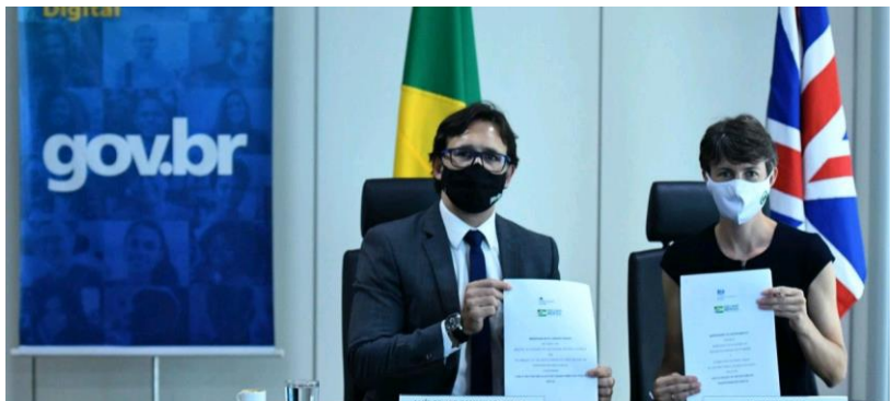
Memorando de Entendimento – Secretaria de Governo Digital - Dezembro de 2020