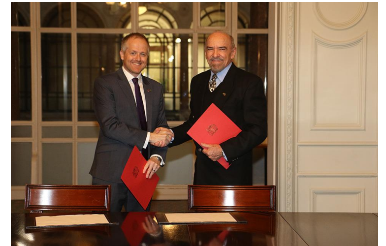
Memorando de Entendimento – Departamento de Segurança da Informação – GSI – Novembro 2022