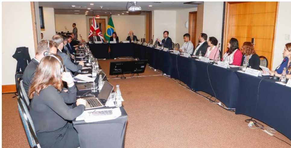
Consultas – Cyber Maturity Model (CMM) com Universidade de Oxford