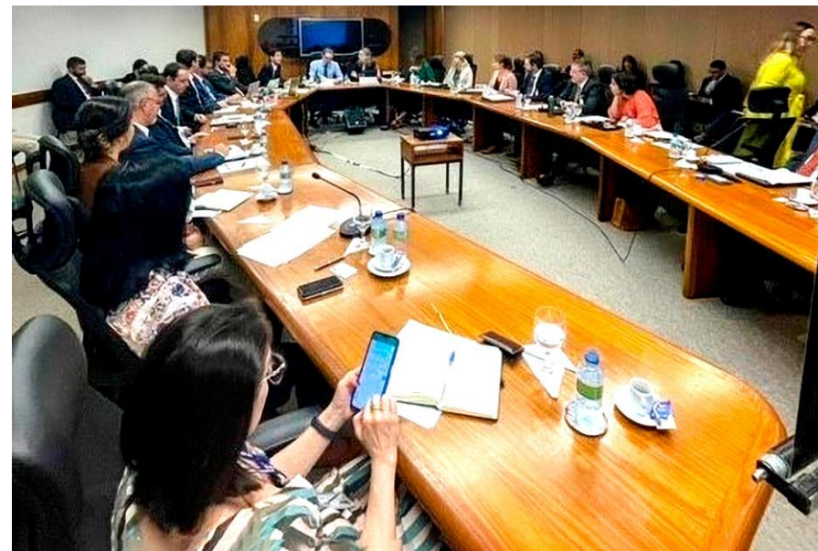
III Diálogo Digital Brasil-Reino Unido