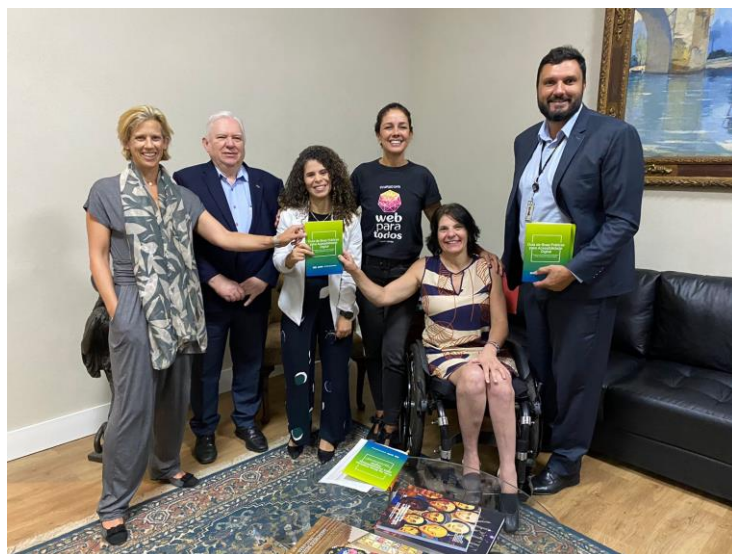
Projeto de promoção de boas práticas de acessibilidade digital com a SGD - MGI