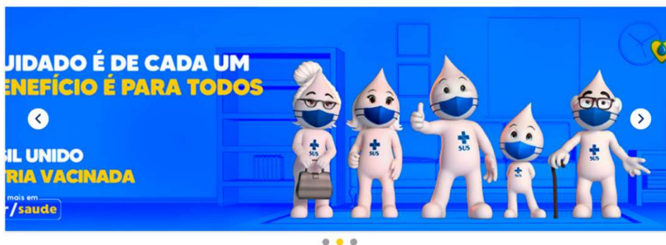
[Figura 1.7 - Item sem Título e Descrição]