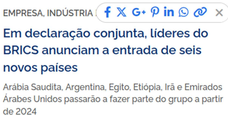
[Figura 2.3 - Tile de Notícias com novo ícone]