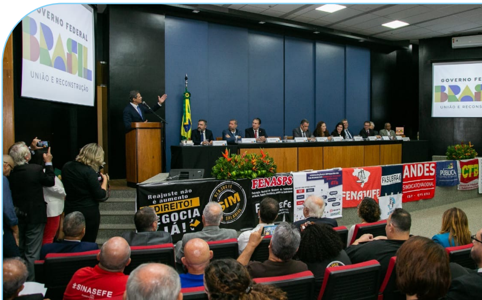
Cerimônia de reinstalação da MNNP, em 7 de fevereiro de 2023.

O governo federal reativou a MNNP no início de 2023. Ela havia sido instituída originalmente em 2003, ainda na primeira gestão do governo Lula, mas suas atividades foram interrompidas em 2016. Com a retomada, o governo federal reabre o diálogo com o conjunto das entidades sindicais representativas das servidoras e dos servidores públicos.