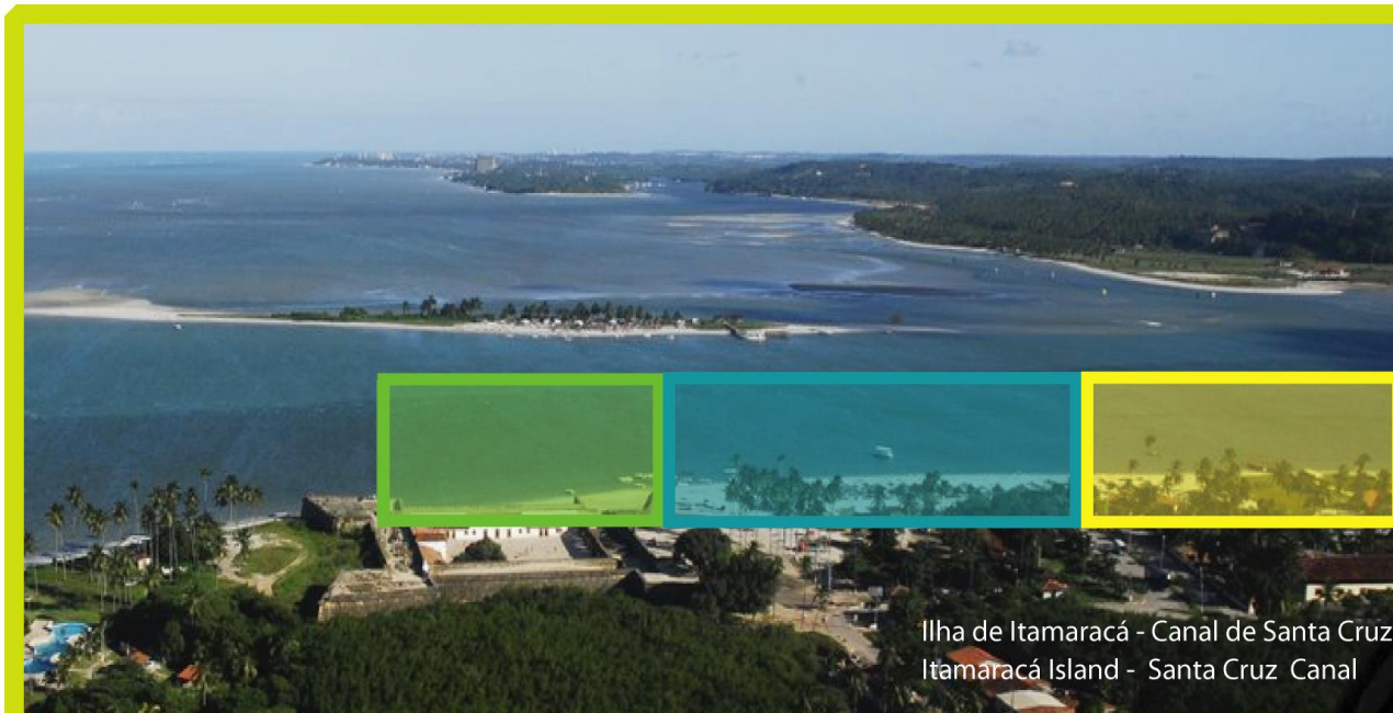
Ilha de Itamaracá - Canal de Santa Cruz Itamaraca Island - Santa Cruz Canal