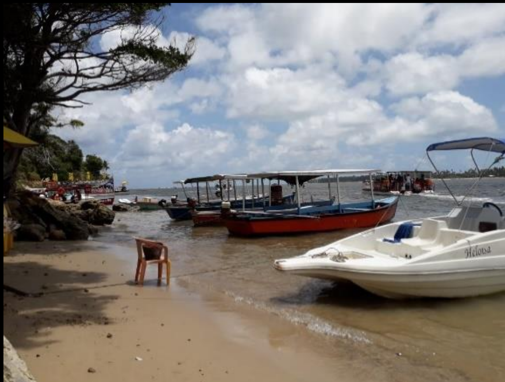
: Praia da Argila