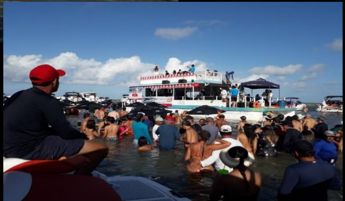
Encontro de lanchas na Praia dos Carneiros