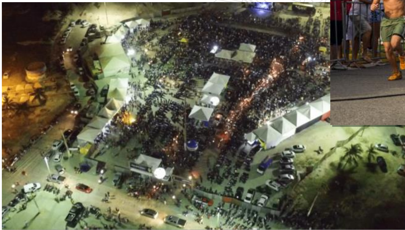
fig. 3 – Evento Moto Fest Aracaju 2018