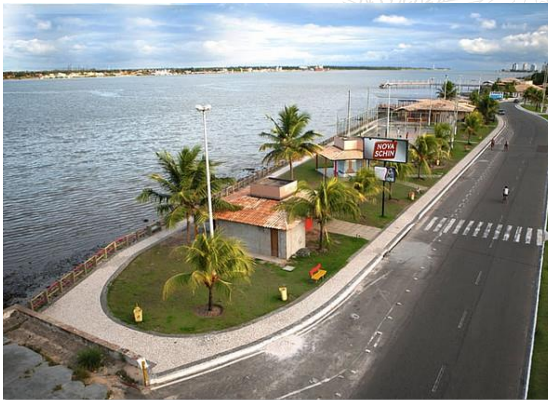
fig. 1 – Orla do Bairro Industrial, em Aracaju/SE