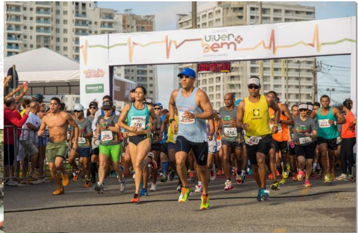
fig. 4 – Corrida Viver Bem 2019