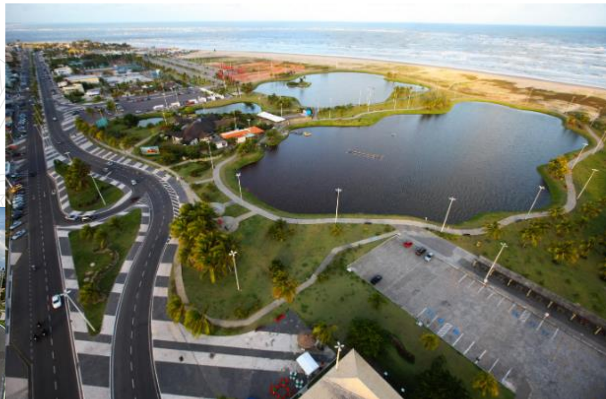
fig. 2 – Passarela do Caranguejo (Orla de Atalaia)