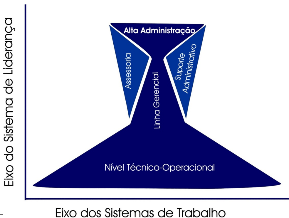
Figura 1 Representação gráfica dos componentes das estruturas do Poder Executivo Federal

Esses componentes organizam-se em dois eixos principais, conforme apresentação gráfica da Figura 1: