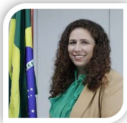
Ministra Esther Dweck

Esse é o compromisso das instâncias de governança, das lideranças e do corpo de servidores do Ministério da Gestão e da Inovação em Serviços Públicos. Esse é o propósito último de cada iniciativa do Plano ora apresentado: operacionalizar as entregas, com inequívoco compromisso com a integridade e a ética.