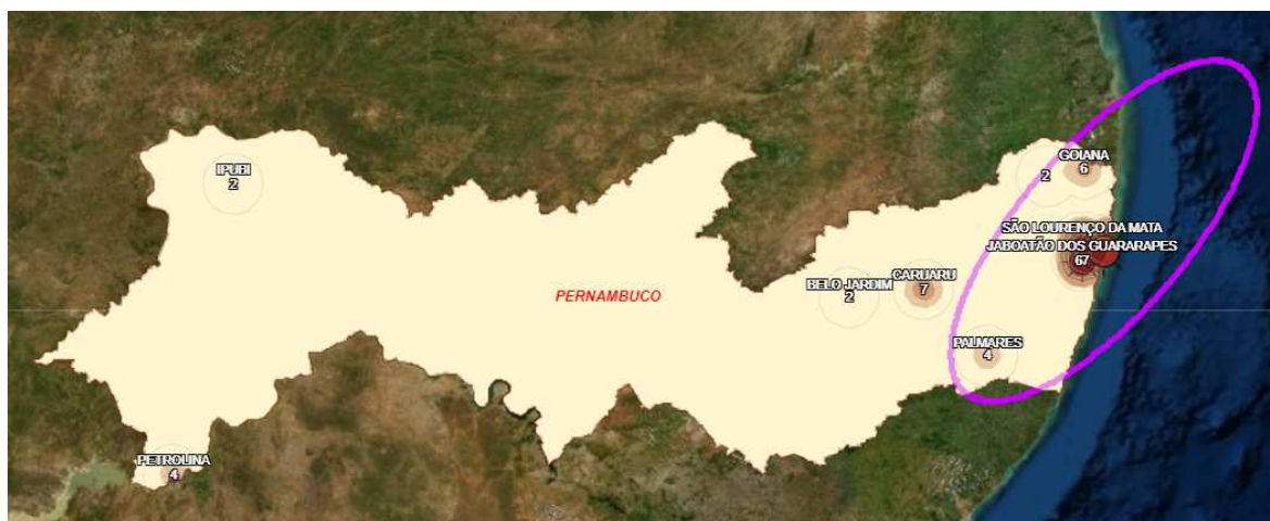
Figura 1: 01 de Abril - 90 casos residentes

Abril foi o mês da conquista do território pernambucano pela pandemia. Analisando os mapas e dados de abril do painel analítico disponibilizado pelos pesquisadores do Centro Integrado de Estudos Georreferenciados (CIEG) da Fundação Joaquim Nabuco (Fundaj) é possível verificar como ocorreu essa conquista, a evolução e a dinâmica espacial dos casos.