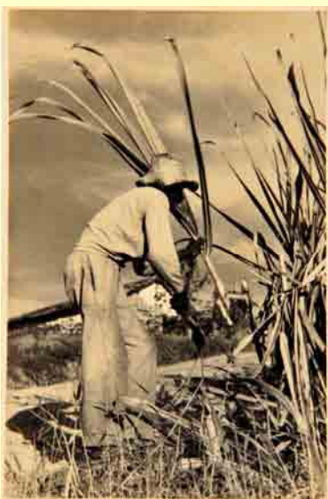
Corte de cana IV fotografia p&b 1940-1944