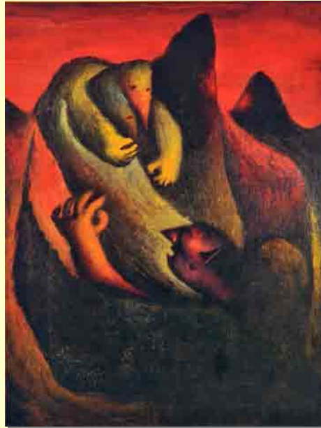
Diabo óleo s/ tela 1945