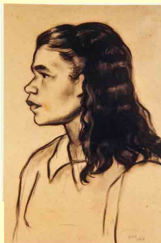
Perfil de menina carvão s/papel, 1942