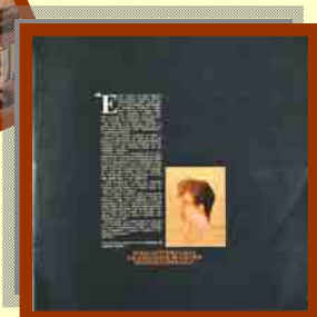
Antônio Maria Gravadora original RCA Victor Lançamento pela Abril Cultural, 1970