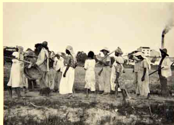
Trabalhadores chegando ao campo fotografia p&b 1940-1944