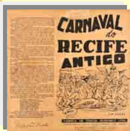
Carnaval do Recife Antigo Gravadora Rozenblit, 1957 [Acervo Fundaj/Cehibra, LP 3497]