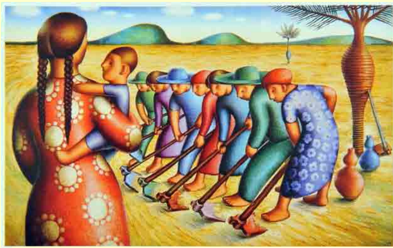
Eito óleo s/ madeira 1945.