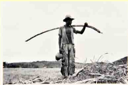
Trabalhador com cana e moringa I fotografia p&b 1979