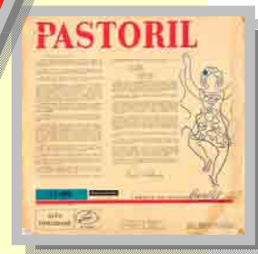
Pastoril Gravadora Rozenblit, 1975 [Acervo Fundaj/Cehibra, LP 106]