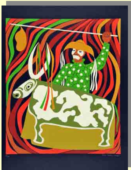
Boi e Mateus serigrafia 1977.