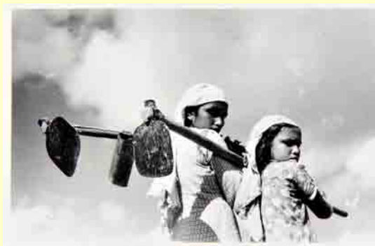
Crianças com enxada I fotografia p&b 1940-1944