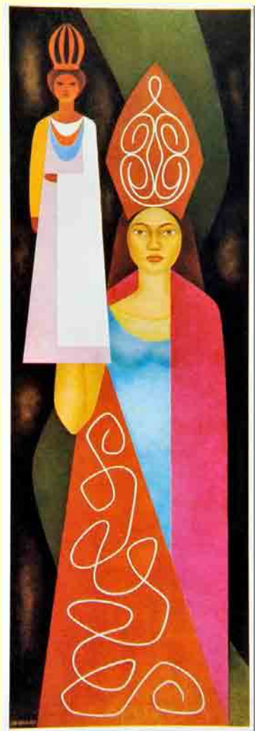
Boneca do Maracatu , óleo s/ tela 1977.