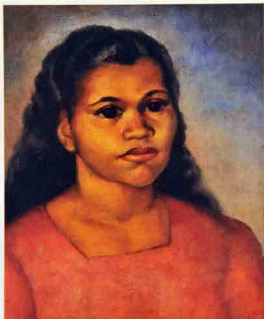
Retrato de Menina óleo s/ tela 1942