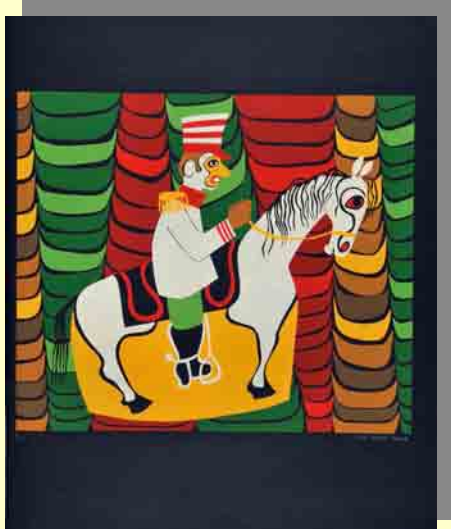
Cavalo Marinho serigrafia, 1975