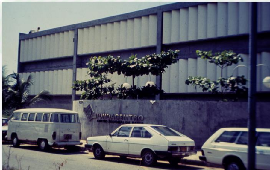
Sede do Centro Regional desde 1983