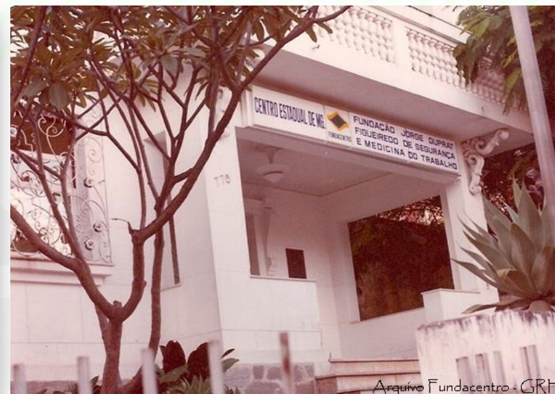
Instalação do Centro Estadual na sede à Rua Santa Catarina