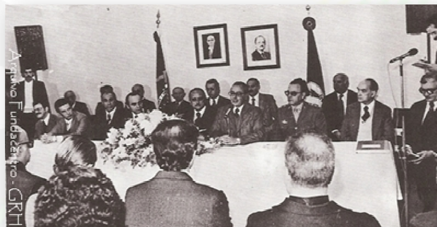
Inauguração da sede do centro regional em Porto Alegre, em 1977