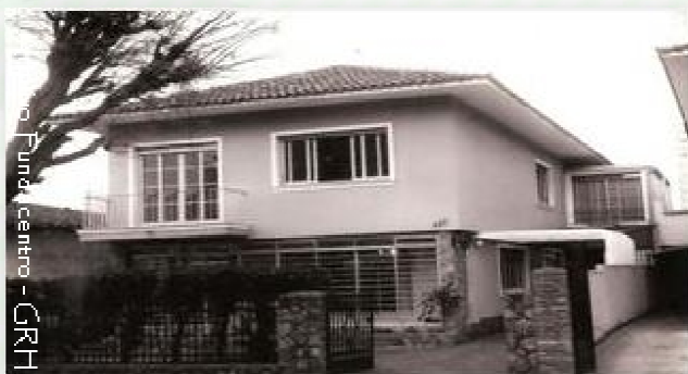
Sede do departamento técnico à Rua Traipú, 527