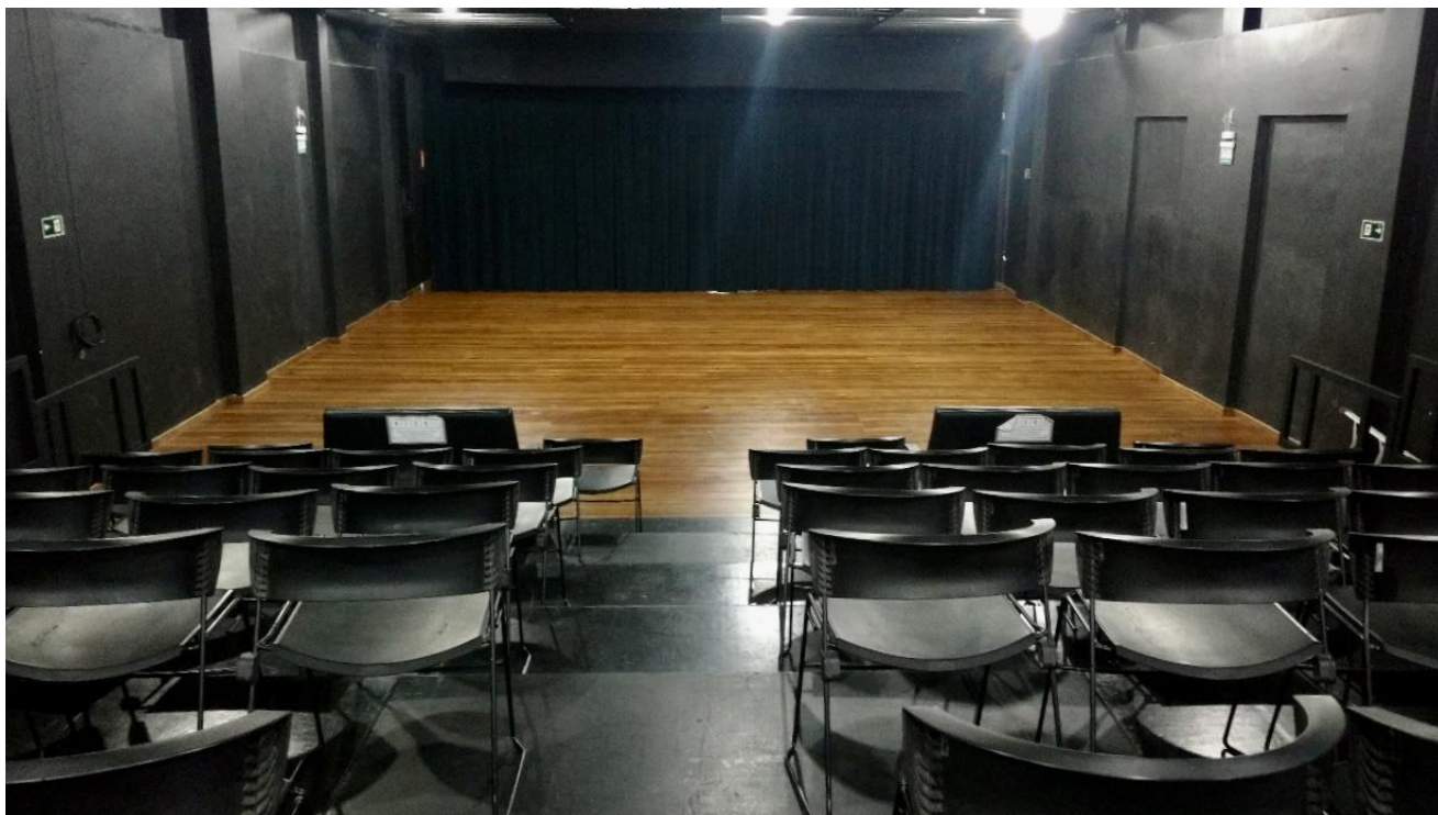
INTERIOR DO GALPÃO