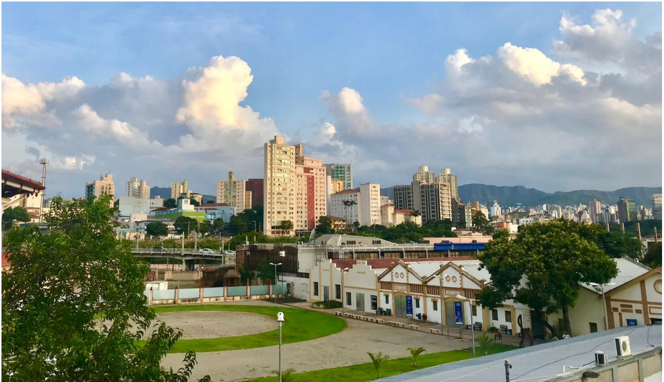
IMAGEM AÉREA DO COMPLEXO