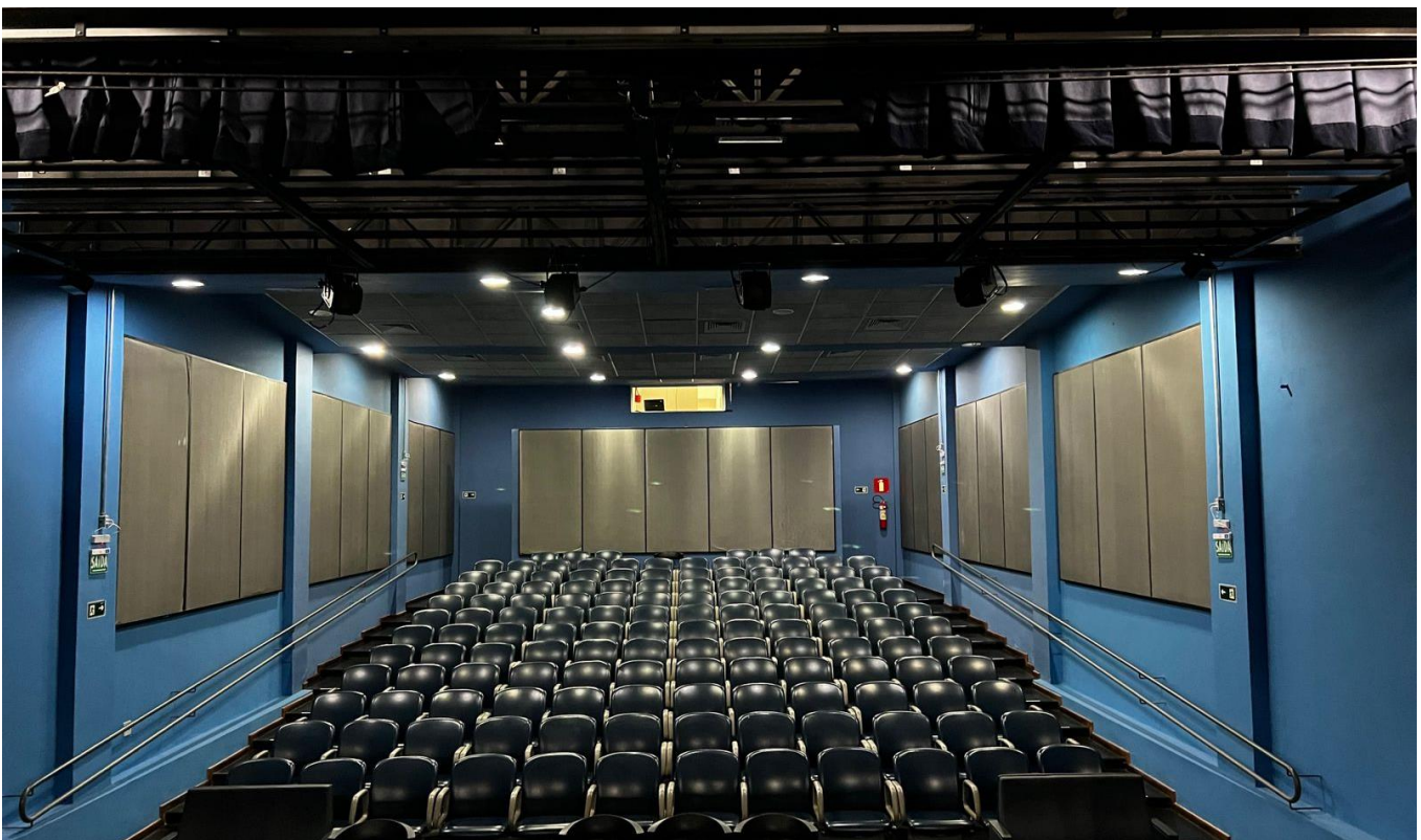
INTERIOR DO GALPÃO 01