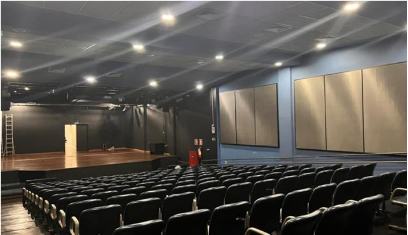
INTERIOR DO GALPÃO 01