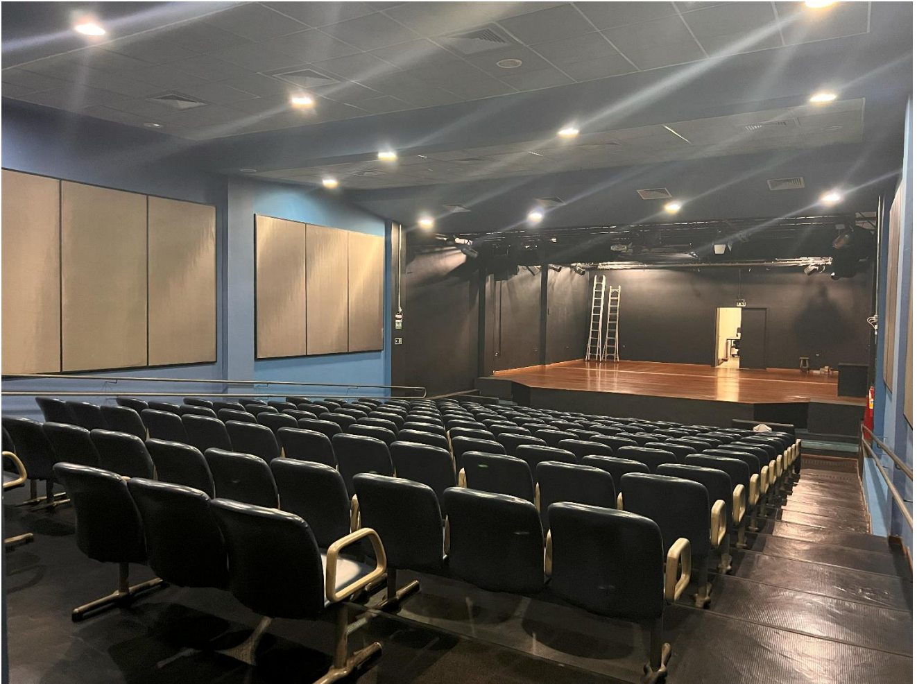
INTERIOR DO GALPÃO 01