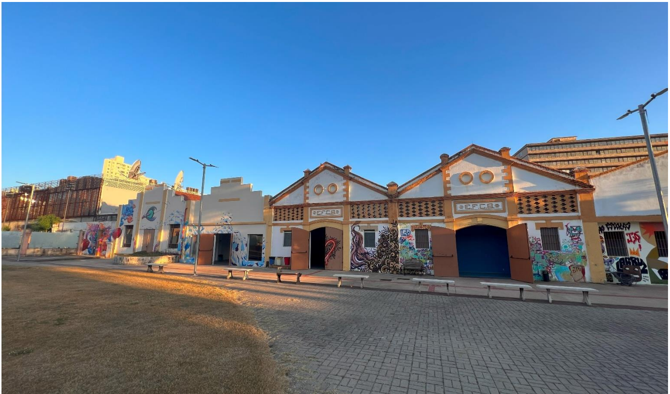
IMAGEM DA FACHADA DOS GALPÕES