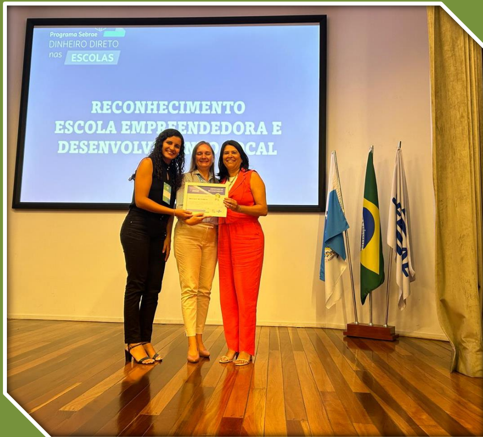
Reconhecimento Sebrae Serrana I