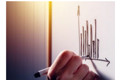
Maior retorno econômico