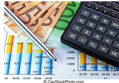
Técnica e preço