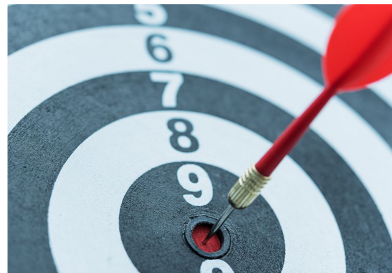
Melhor técnica ou conteúdo artístico