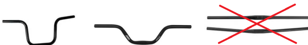
Figura 2 – Imagem meramente ilustrativa do modelo do guidão

3.1.5 Guidão – deve ser do tipo curvo ou “cruiser bars” ou “caiçara” (ver figura 2), construído em aço carbono, em dimensões compatíveis com a bicicleta. Não serão aceitas bicicletas com guidão linear, no qual as extremidades estejam em um mesmo plano vertical do ponto de fixação com o Garfo.