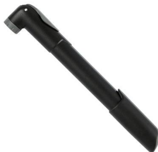
Figura 7 – Imagem meramente ilustrativa da mini bomba manual

3.1.27.2 Mini bomba manual: com bico reversível, válvula grossa (tipo americana ou Schraeder), com tubo de plástico reforçado, com alavanca de travamento com o polegar, preferencialmente na cor preta.