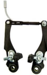
Figura 4 – Imagem meramente ilustrativa do freio “V-break”

3.1.11 Freio e alavanca de freio – deve ser dianteiro e traseiro, tipo V-brake em aço , com manetes posicionados no guidão, de fácil manejo e resistentes. Com método construtivo que atenda aos requisitos da ABNT 14868:2015.