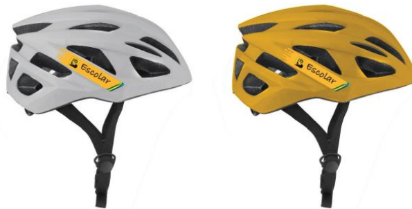
Figura 11 – Imagem meramente ilustrativa do capacete escolar com adesivos aplicados

6.1.4. Os projetos de adesivos podem ser ajustados em função do modelo do capacete, mas a identidade visual precisará cumprir com a função de identificar o capacete quando em uso pelos estudantes.