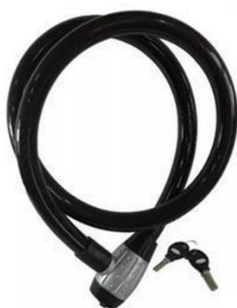
Figura 6 – Imagem meramente ilustrativa do cadeado de trava de cabo de aço

3.1.27.1 Cadeado de trava de cabo de aço: Junto a bicicleta deverá ser entregue um cadeado de trava confeccionado em aço recoberto com borracha ou silicone, com cadeado, com no mínimo 8mm de diâmetro, duas chaves de proteção e com cabo de aço de no mínimo 120cm de comprimento para coibir o furto da bicicleta e do selim.