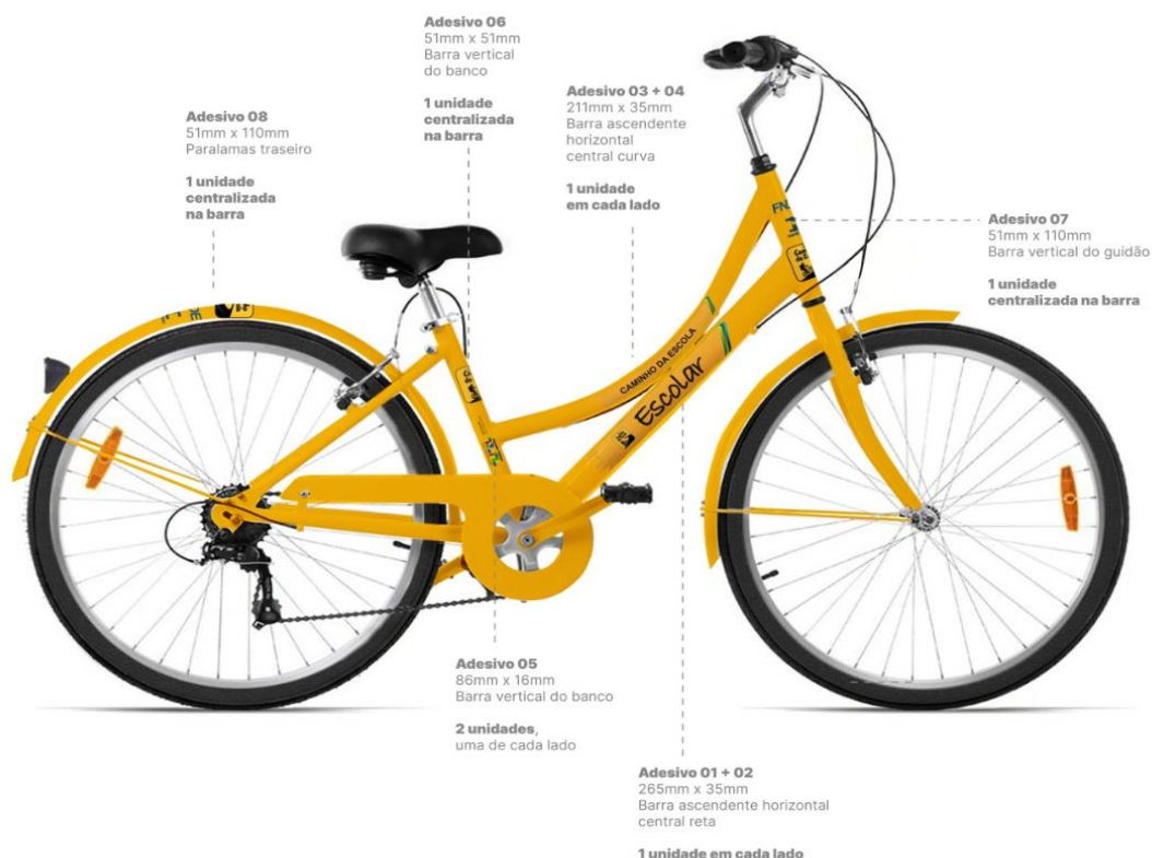
Figura 8 – Imagem meramente ilustrativa da bicicleta adesivada.

5.1.2.2 As posições devem ser conforme imagens abaixo.