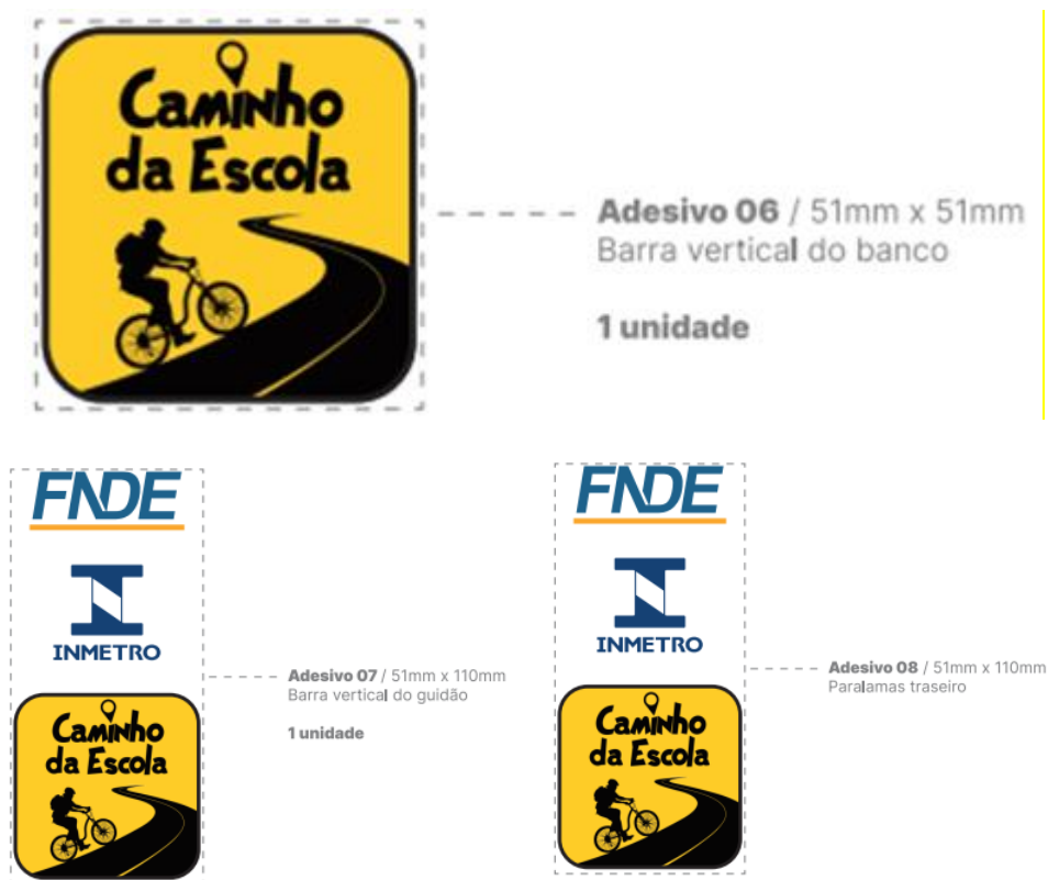
Figura 9 – Imagem do padrão de adesivos.

5.1.3. Os projetos de adesivos podem ser ajustados em função do modelo de quadro das bicicletas, guardando a devida proporção ao diâmetro dos tubos que compõe o quadro, contudo a identidade visual precisará cumprir com a função de identificar a bicicleta quando em uso pelos estudantes.