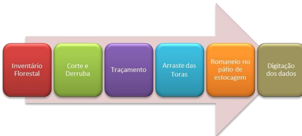
Figura 2: Atividades que participam do controle e monitoramento da cadeia de custódia da madeira.

Para o rastreamento da madeira nas diversas etapas do manejo, serão desenvolvidas algumas atividades que visam garantir o controle de toda a cadeia da madeira desde a árvore que será explorada até a saída da unidade de processamento industrial.