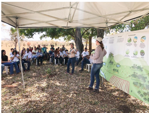
Equipe do SFB em Campina Verde (27/08)