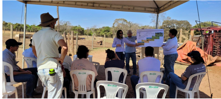
Equipe da Embrapa em Uberaba (18/08)