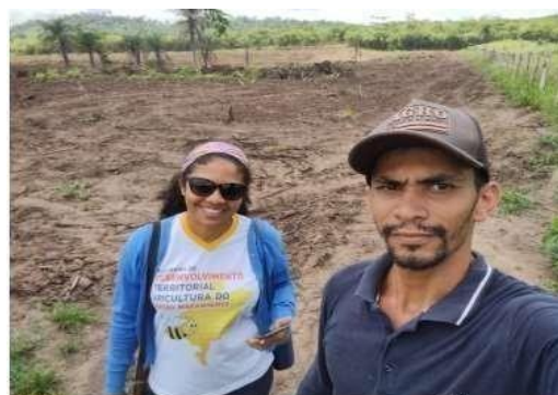
Reforma de pastagem com ILP em 2022 (5 ha)