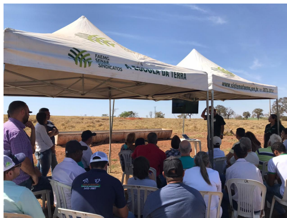
Parceiros em Campina Verde (27/08)

Confira outras informações e mais detalhes dos eventos na matéria de cobertura publicada pelo Sistema FAEMG no link .