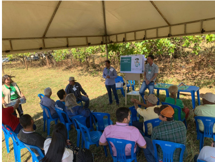
Equipe do SENAR/MG em Ituiutaba (13/08)

Uberaba, Monte Alegre de Minas e Campina Verde, movimentando cada um deles, cerca de 150 pessoas entre técnicos de campo, supervisores, coordenadores regionais do SENAR, produtores e produtoras rurais, professores universitários e estudantes de graduação e pós-graduação das universidades da região. Os encontros contaram com estações e exposições de temáticas diversas como alimentação e cuidados na criação dos rebanhos, manejo de pastagens e um espaço para apresentar as ações do projeto na propriedade e esclarecimentos sobre legislação ambiental.