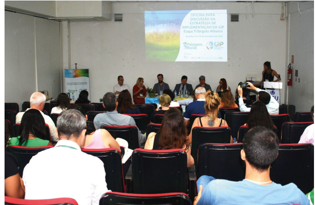
Momentos da Oficina: mesa de abertura e apresentação para a plateia.

Reunidos em grupos de trabalho, os participantes definiram áreas prioritárias para atuação, ações e estratégias de governança e comunicação em uma construção colaborativa para subsidiar um plano de ação e pactuar a Rede GIP. As atividades a serem implementadas têm como finalidade incentivar a 'Gestão Integrada da Paisagem', a partir da conectividade entre fragmentos de vegetação nativa, fluxos hidrológicos e processos ecológicos. Mais de dez municípios do Triângulo Mineiro estão envolvidos na iniciativa. Confira no link a entrevista concedida por Fernando Castanheira Neto, Coordenador-Geral de Fomento Florestal do SFB, para a TV Record de Minas.