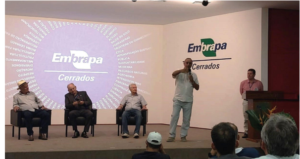
Equipe do projeto no auditório e foco nos pesquisadores estreado o novo palco.

Os novos espaços estão prontos para receber atividades nos formatos presencial e híbrido, e sediarão diversos eventos técnico-científicos, reuniões, simpósios e cursos de capacitação. A unidade Embrapa atua em atividades de pesquisa e desenvolvimento que buscam ampliar o conhecimento, a preservação e a utilização racional dos recursos naturais do bioma Cerrado, além de desenvolver sistemas de produção sustentáveis em equilíbrio com a oferta ambiental da região. No projeto FIP Paisagens Rurais, a Embrapa Cerrados atua com transferência de tecnologia, capacitações e treinamentos dos técnicos e técnicas de campo que trabalham diretamente com os mais de 4 mil produtores rurais participantes.