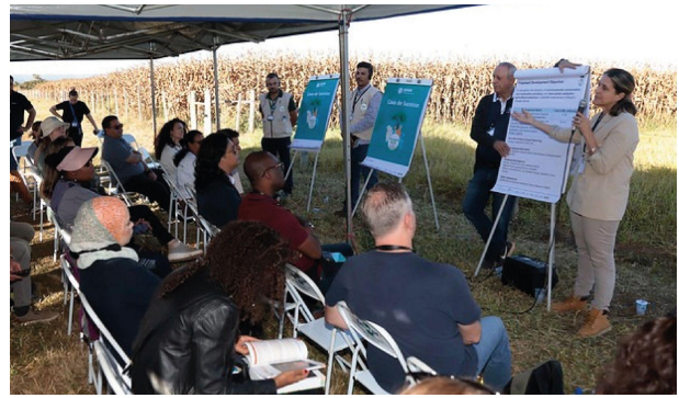
Detalhes sobre a atividade de campo na Embrapa Cerrados

Quer saber mais? Confira no perfil do FIP Brasil no Instagram os posts de cobertura do evento e neste link os materiais produzidos especialmente para a celebração. Uma matéria especial da Embrapa detalhou a atividade de campo e teve uma matéria geral sobre o evento no site do MAPA também. Quer se aprofundar mais ainda? No YouTube está disponível a íntegra dos painéis do dia 27 de junho e, neste link , vale conferir a Declaração de Brasília sobre o futuro do CIF.