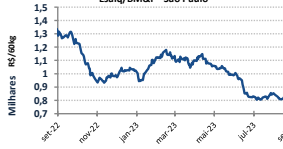
Gráfico Evolução Preços - Indicador Café Esalq/BM&F - São Paulo**