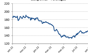
Gráfico Evolução Preços - Indicador Soja Esalq/BM&F - Paranaguá**