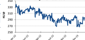
Gráfico Evolução Preços - Indicador Boi Gordo Esalq/BM&F - São Paulo**

Preço Mínimo - /60 Kg (Arábica) R$ 606,66(Conilon) - R$ 434,82