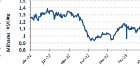
Gráfico Evolução Preços - Indicador Café Esalq/BM&F - São Paulo**