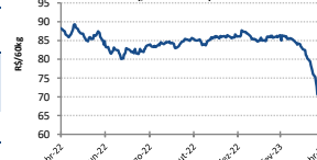
Gráfico Evolução Preços - Indicador Milho Esalq/BM&F - Campinas**