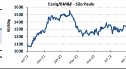
Gráfico Evolução Preços - Indicador Café Esalg/BM&F - São Paulo