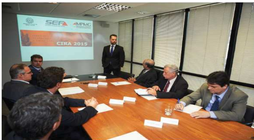
Promotor apresenta balanço do CIRA para autoridades

Página Inicial > Notícias > Comitê de combate à sonegação recupera R$ 135 milhões em débitos para o Estado Comitê de combate à sonegação recupera R$ 135 milhões em débitos para o Estado Resultado é fruto de ação conjunta de órgãos estaduais, encabeçados por Fazenda, AGE e MPMG.