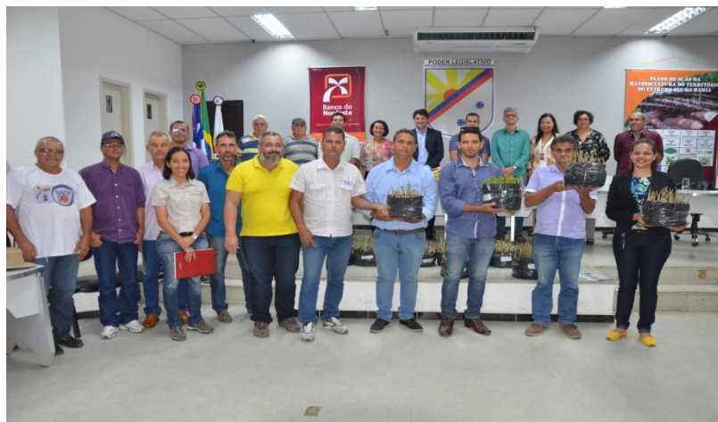
Lançamento do PAT da Mandiocultura no Extremo Sul Baiano