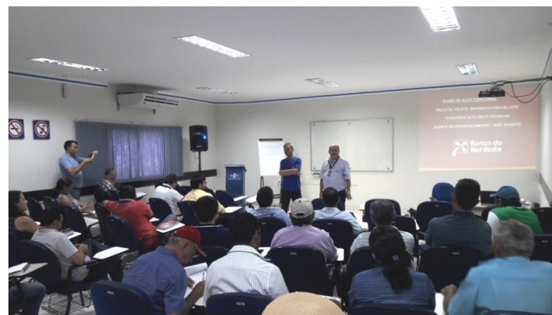
Lançamento do PAT da Bovinocultura de Leite no Alto Oeste Potiguar (RN)