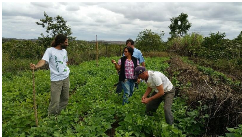
Agente de Desenvolvimento do Espírito Santo visitando plantio de feijão orgânico