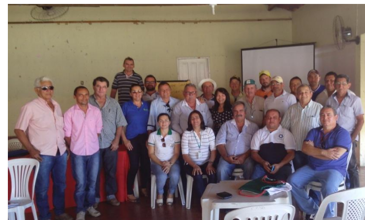
Reunião do Comitê da Bovinocultura de leite em Iracema(CE), Territ. de Lim. do Norte(CE)