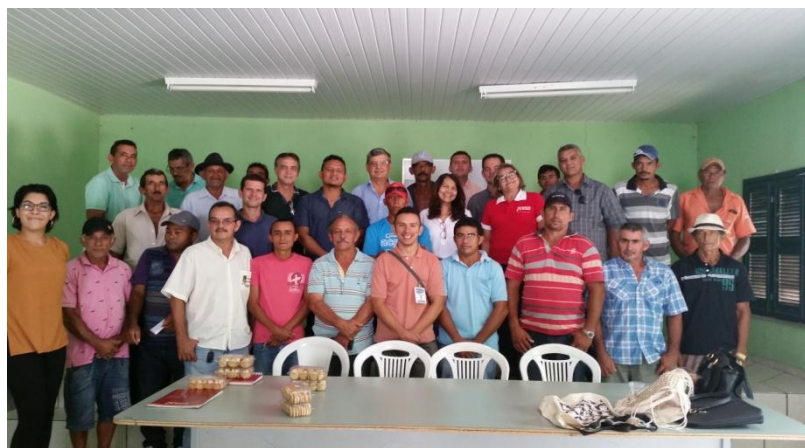
Reunião em Irauçuba(CE), Território de Sobral(CE) - resultado da pesquisa de campo