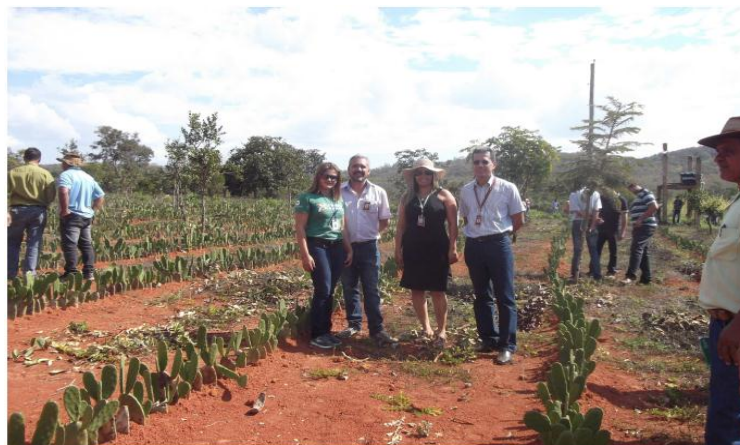
Dia de campo sobre cultivo de palma forrageira no Território de Pirapora(MG)