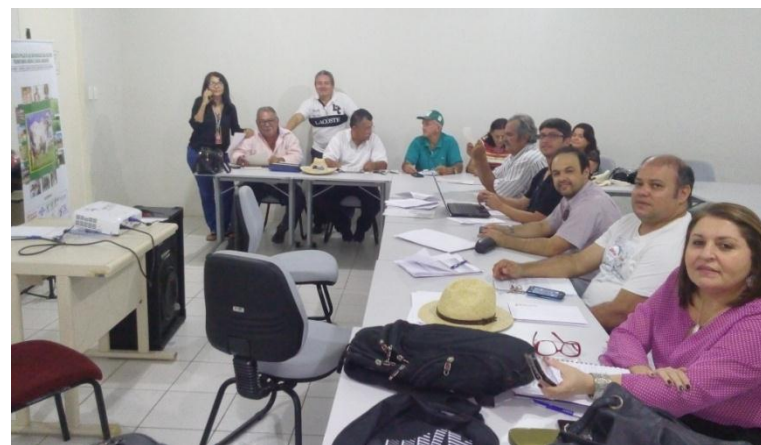
Reunião do Comitê da Bovinocultura de Leite no Território de Limoeiro do Norte(CE)