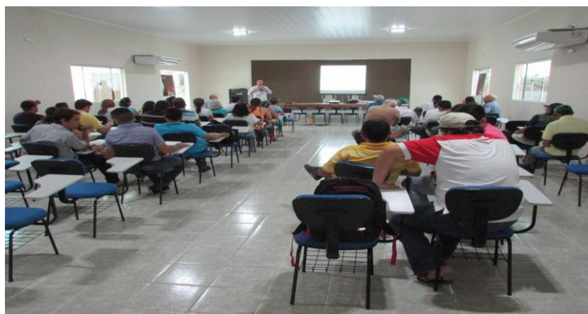
Lançamento do PAT da Bovinocultura de Leite no Seridó (RN)