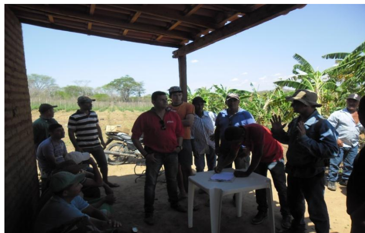
Dia de campo sobre Apicultura na Serra da Capivara (PI)