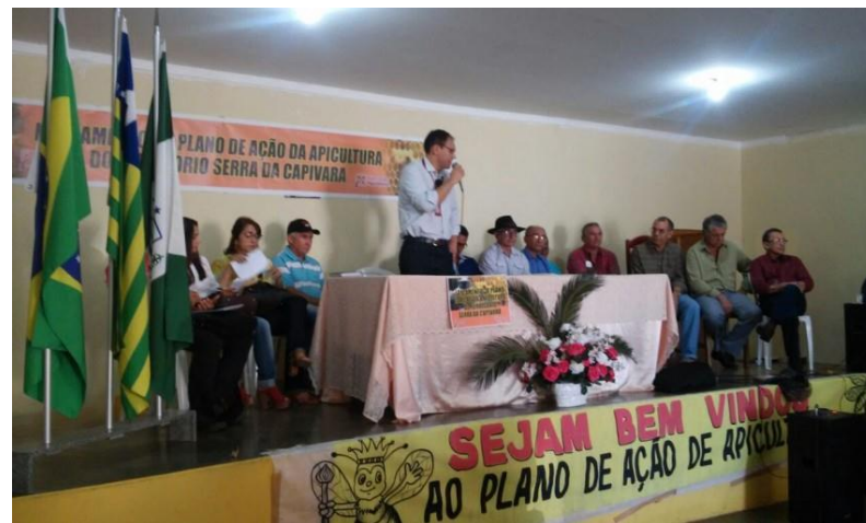
Lançamento do PAT da Apicultura na Serra da Capivara (PI)