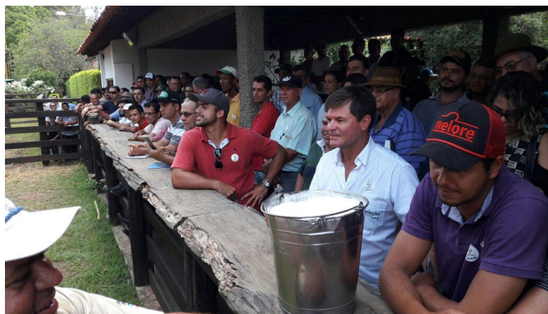
Dia de campo sobre bovinocultura de leite e corte no Território de Pirapora(MG)