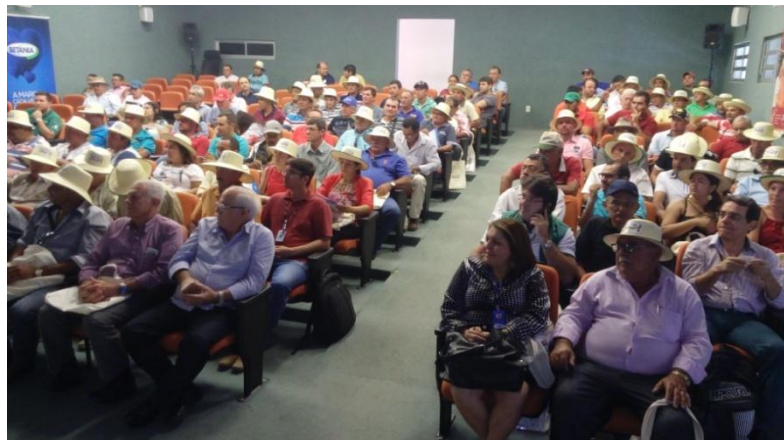
Validação do PAT da Bovinocultura de Leite do Baixo Jaguaribe