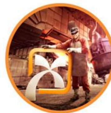
Governo e Infraestrutura