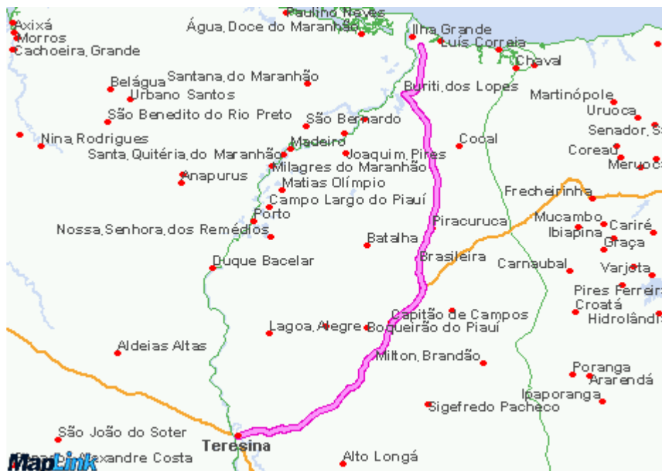
Rota Entre Teresina, Piri-piri ,Parnaíba 1 – (maplink.uol.com.br)

A economia é voltada para o turismo, pesca, carcinicultura, artesanato ,leite e derivados, agricultura e indústria de confecção.