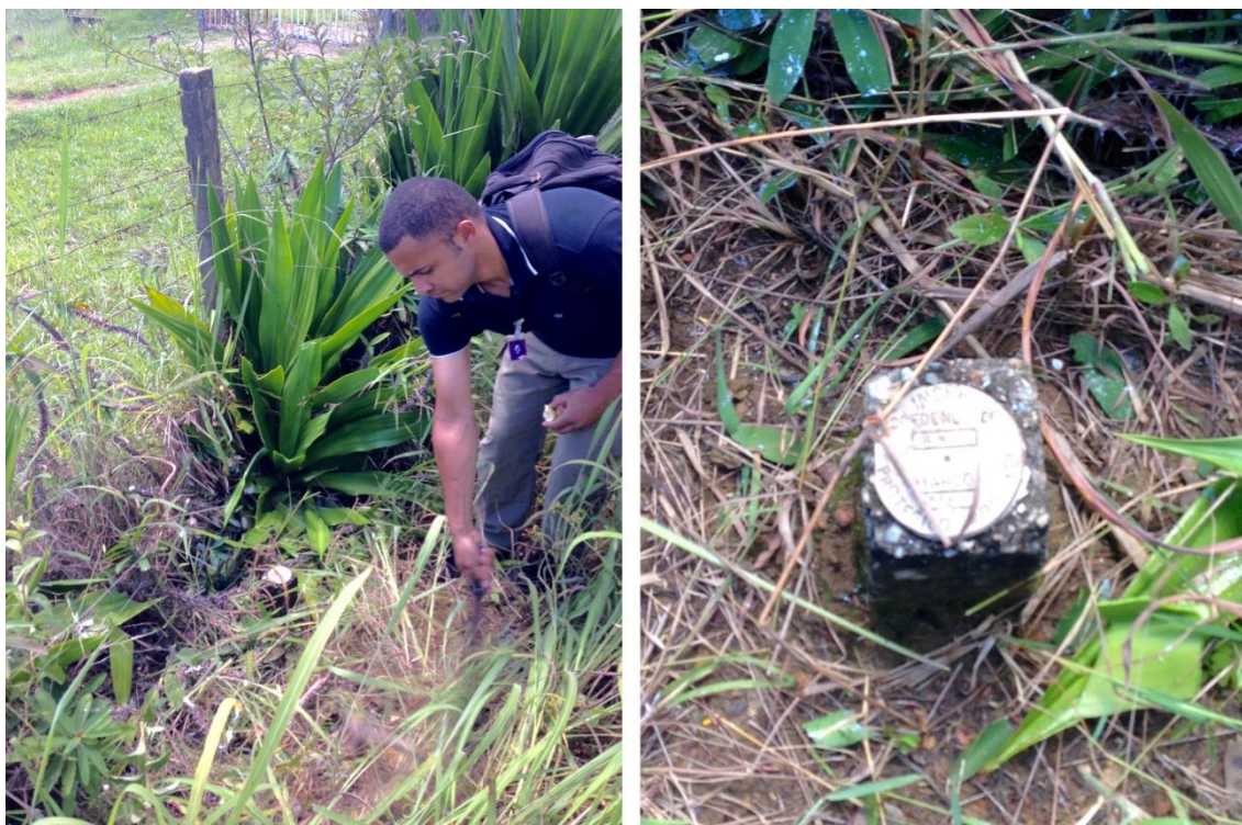
Figura 12: Limpeza da área próxima ao marco geodésico - AAG-M-0128.