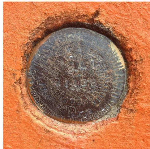
Figura 03: Marco Geodésico “SAT 91138” - IBGE.