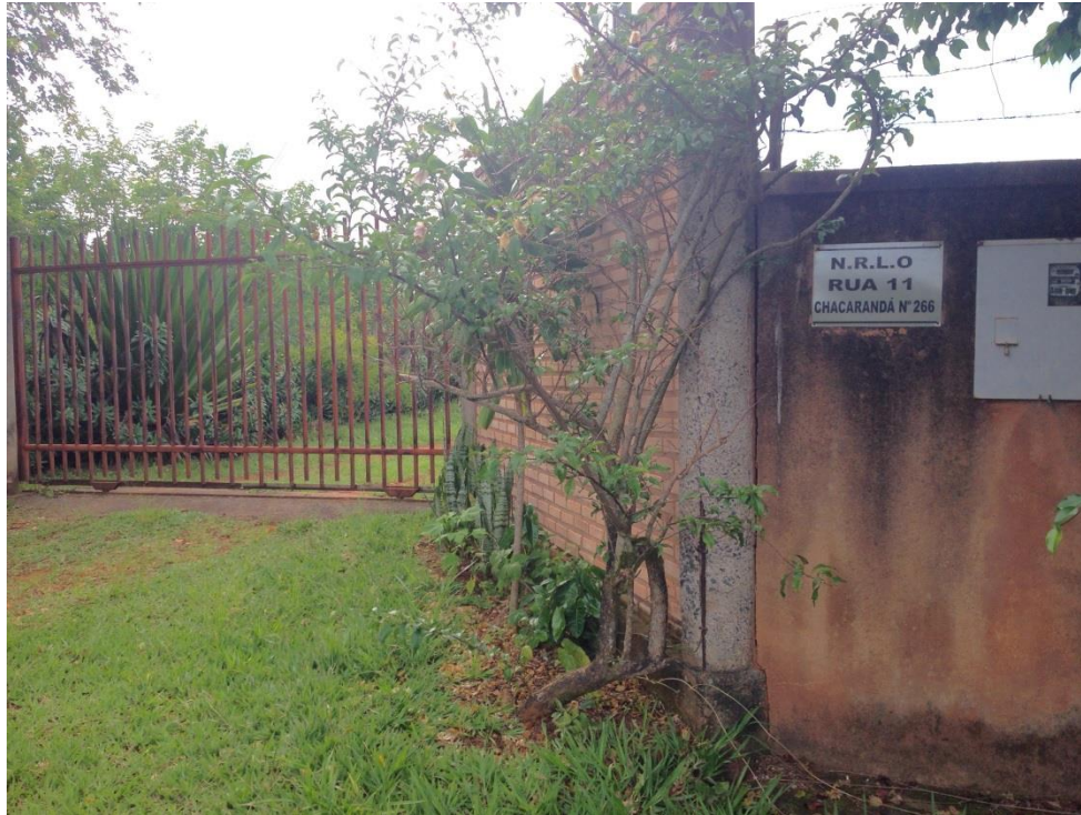
Figura 04: Portão da Chácara da Dona Rosa (Rua 11, Chácara Nº 266).

O marco geodésico em questão foi sugerido pelo geógrafo Juliano Aragão, de nomenclatura AAG-M-0128. De acordo com memoriais das áreas, foram usados diferentes sistemas geodésicos resultando em medidas que se sobrepõem, gerando divergências nos dados.