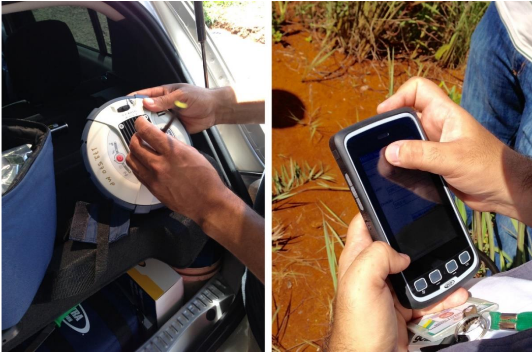
Figura 10: Montagem dos receptores e configuração da coletora.

Ao chegar ao primeiro ponto, o marco geodésico do IBGE – “SAT 91138” a equipe iniciou a montagem dos equipamentos (figura 10). Os receptores foram montados e a coletora configurada com as opções desejadas para a aquisição dos pontos.