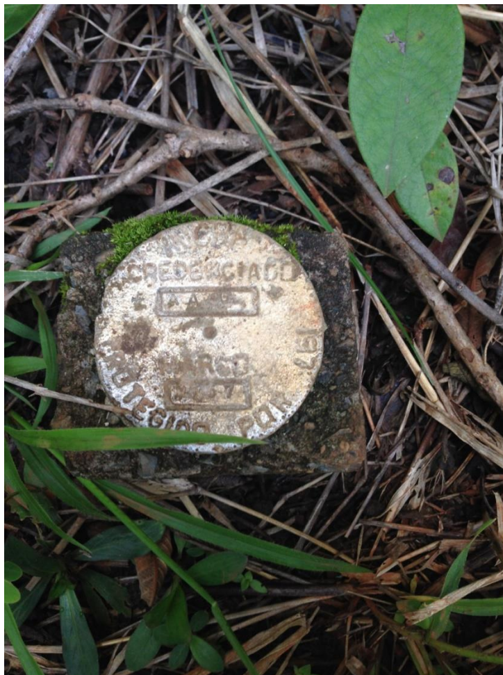
Figura 07: Marco Geodésico AAG-M-009.