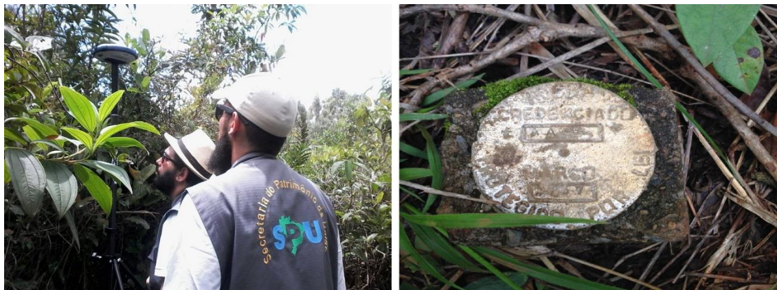
Figura16: Marco geodésico AAG-M-009.