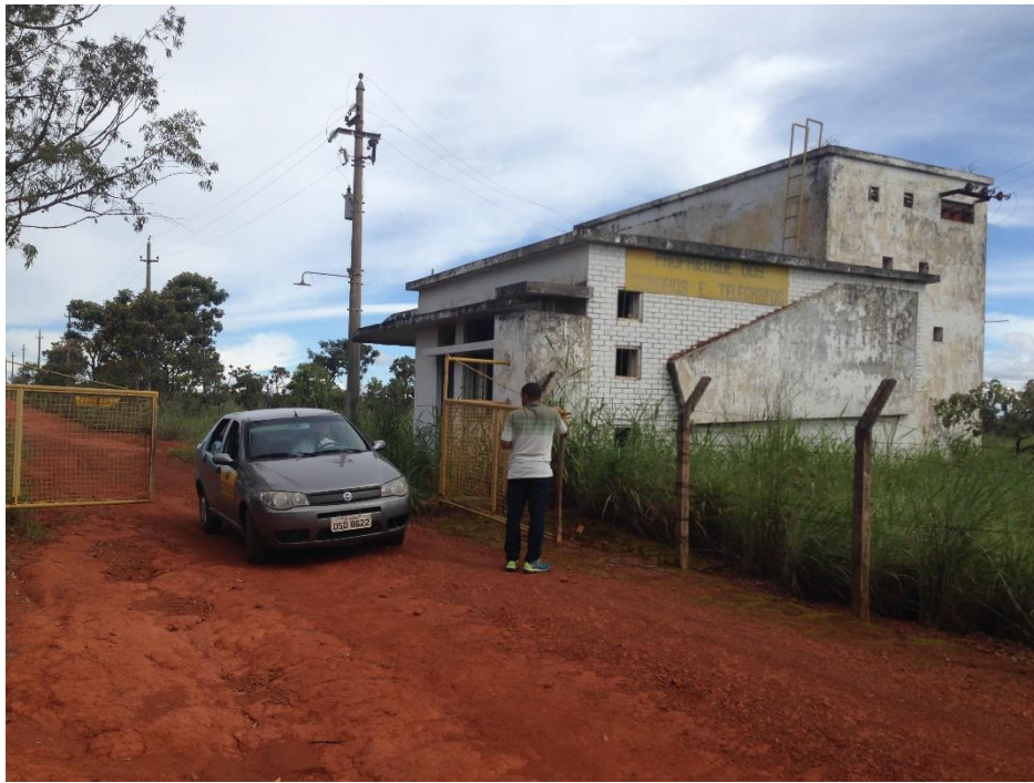
Figura 02: Portão da propriedade dos Correios e Telégrafos

O primeiro marco geodésico verificado foi o “SAT 91138” do IBGE (figura 03). Após a identificação e o registro fotográfico do marco geodésico, os servidores partiram em direção ao outro marco geodésico pretendido.