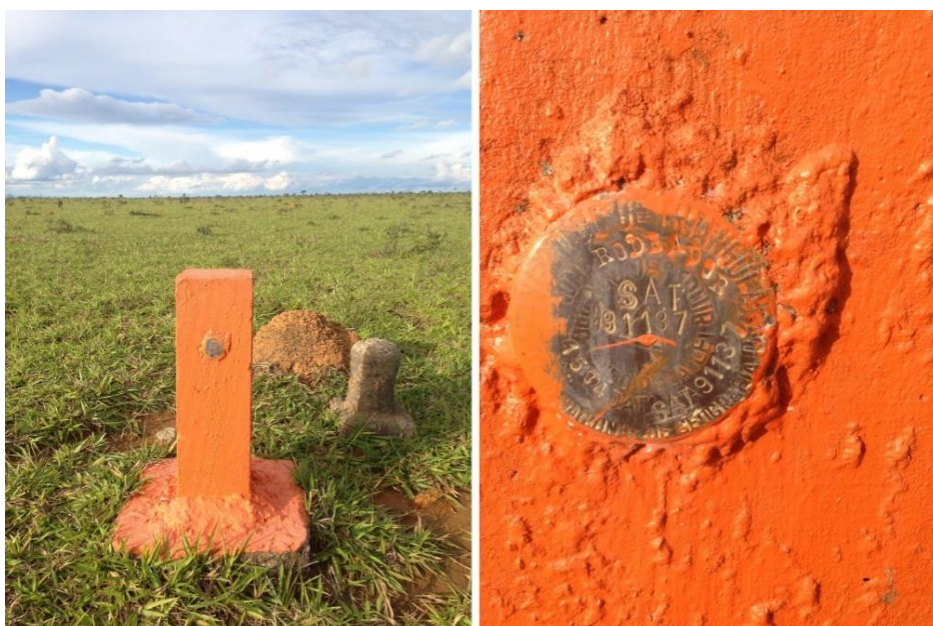
Figura 06: Marco Geodésico do IBGE - “SAT 91137”.

Para ter acesso ao Marco Geodésico do IBGE “SAT 91137” (figura 06) é necessário entrar pelo portão da fazenda Sol Nascente e percorrer uma distância de 2,5 KM até o marco geodésico, que fica próximo a uma antena. O portão principal da fazenda se encontrava fechado e por esse motivo não foi possível entrar com o automóvel. Os funcionários tiveram acesso ao marco geodésico caminhando até o mesmo. Pela sua localização na área de estudo do trabalho de campo, foi identificado como o marco geodésico de maior potencial para a instalação de uma base.