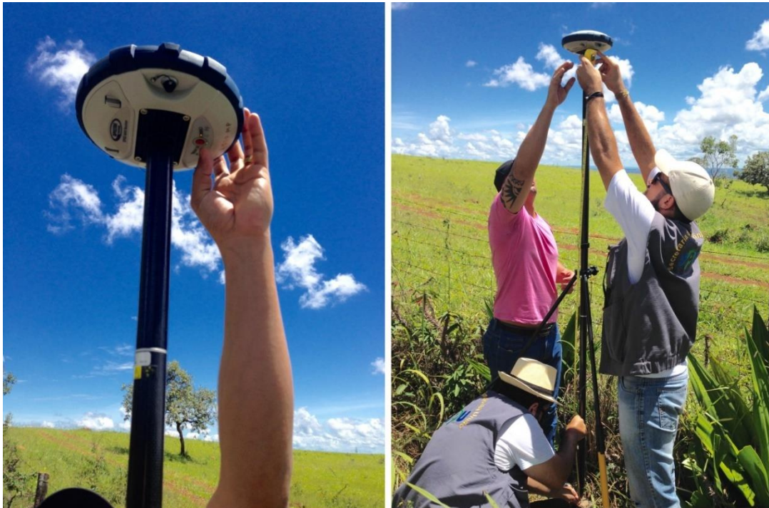
Figura 14: Ligando o receptor após ser instalado no bastão do bipé; Medindo a altura do receptor até o marco geodésico.

Com o bastão extensível instalado de forma correta, a coletora é encaixada no bastão e configurada para iniciar o armazenamento de dados (figura 14). Em seguida, é medida a distância entre o ponto central do marco geodésico e o receptor para colocar a informação na coletora. Por se tratar de um rover , a equipe esperou por cerca de meia hora para ocorrer a coleta de dados e em seguida, se encaminhou para a próxima estação geodésica.