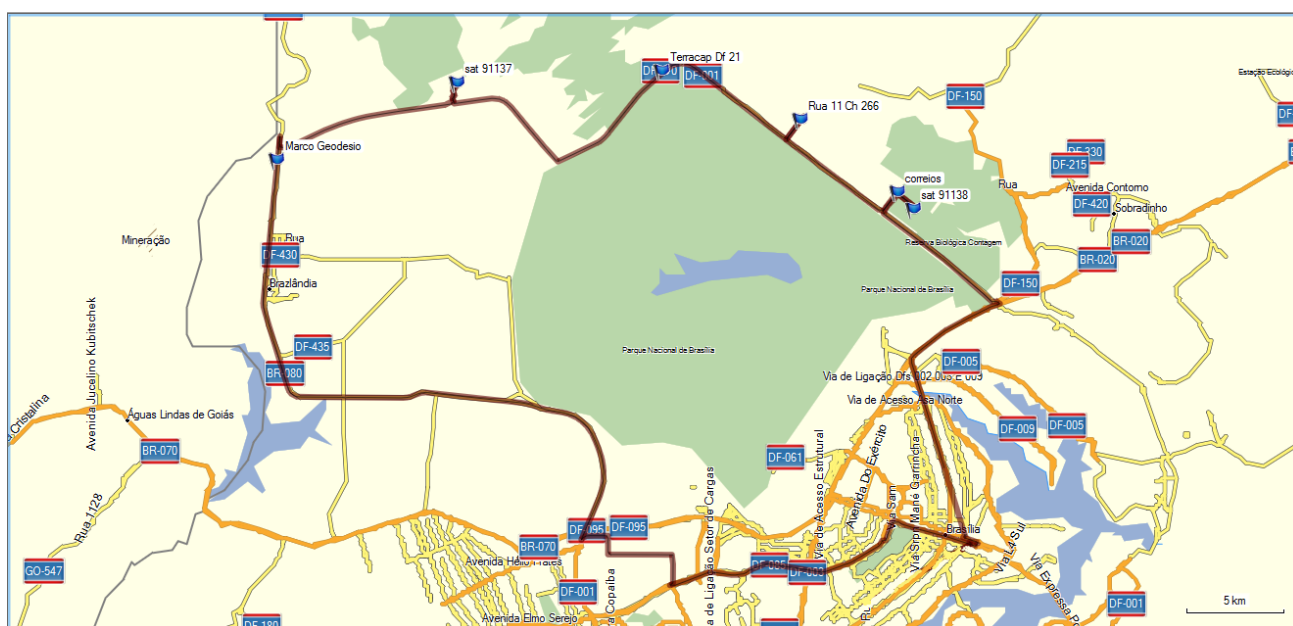
Figura 01: Mapa com o trajeto (linha marrom) realizado no dia primeiro de março, no período vespertino.