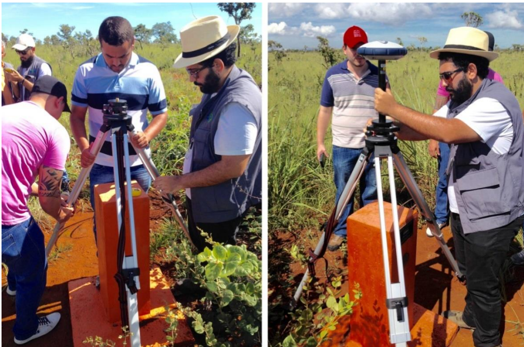
Figura 11: Instalação do tripé e do receptor, após o nivelamento do tripé sobre o ponto materializado.

Após a montagem dos receptores e definir as configurações da coletora, foi feita a instalação do tripé, que consiste em nivelar e estacionar sobre um ponto topográfico. Para estacionar o equipamento de medida sobre um determinado ponto topográfico, o primeiro passo é instalar o tripé sobre o ponto, localizado no centro do marco geodésico.