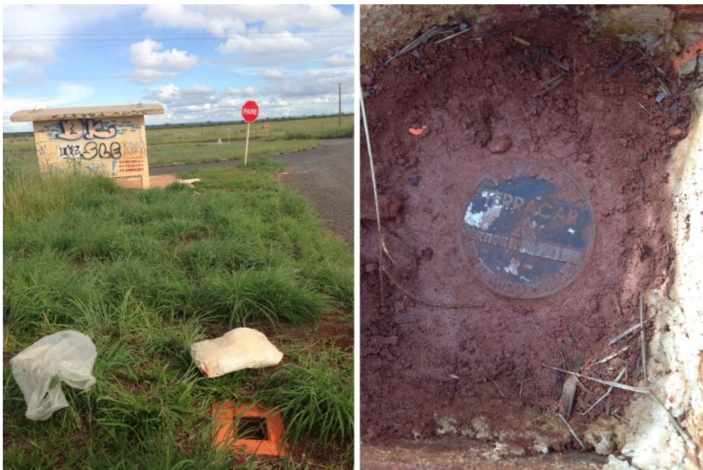
Figura 05: Marco geodésico da Terracap, no trevo que liga a DF-001 à DF-170.

O terceiro marco geodésico trata de apoio geodésico da Terracap (figura 05), localizado no trevo que liga a DF-001 à DF-170. Apesar das condições precárias em que o marco geodésico se encontra, não foi difícil encontrá-lo. Pela sua fácil localização e posição na área de estudo foi levantada a hipótese da escolha da colocação de uma base, no dia do trabalho de campo, neste local.