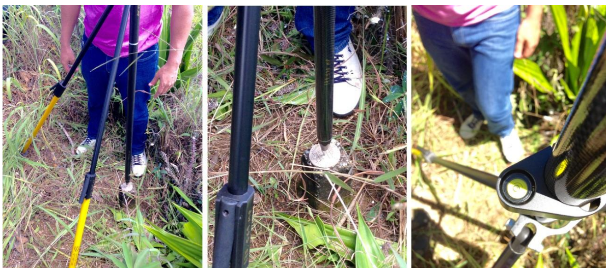
Figura 13: Instalação do bastão no bipé da maneira correta de forma vertical em relação ao marco geodésico. A bolha no centro (terceira foto) mostra a posição correta dos instrumentos.

Após a retirada da vegetação que impedia o acesso ao marco geodésico, o bastão extensível de fibra de carbono de 2 metros, foi acoplado ao bipé extensível. O bastão foi colocado sobre o marco geodésico de forma que ficasse alinhado com o ponto central do marco, de maneira que a bolha ficasse no centro do mostrador (figura 13).