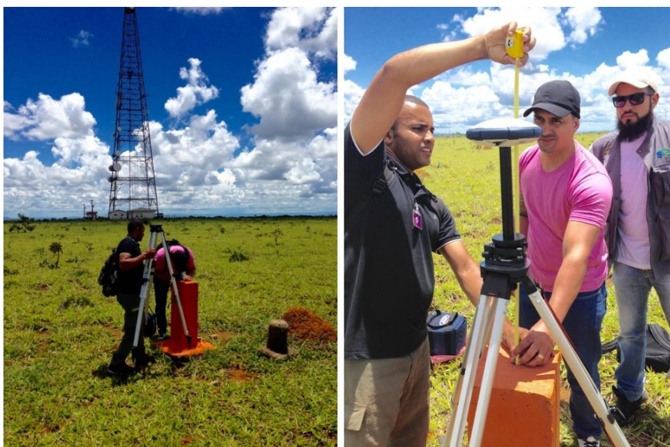
Figura 15: Instalação do tripé e do receptor no marco geodésico do IBGE – “SAT 91137”.

A equipe chegou ao portão da fazenda Sol Nascente e descarregou os equipamentos dos carros e caminhou até o marco geodésico, próximo à antena no meio do pasto. Após a instalação da base (figura 15), dois integrantes foram designados para ficarem no local cuidando do equipamento, enquanto o resto da equipe fosse em direção ao próximo ponto de coleta de dados.