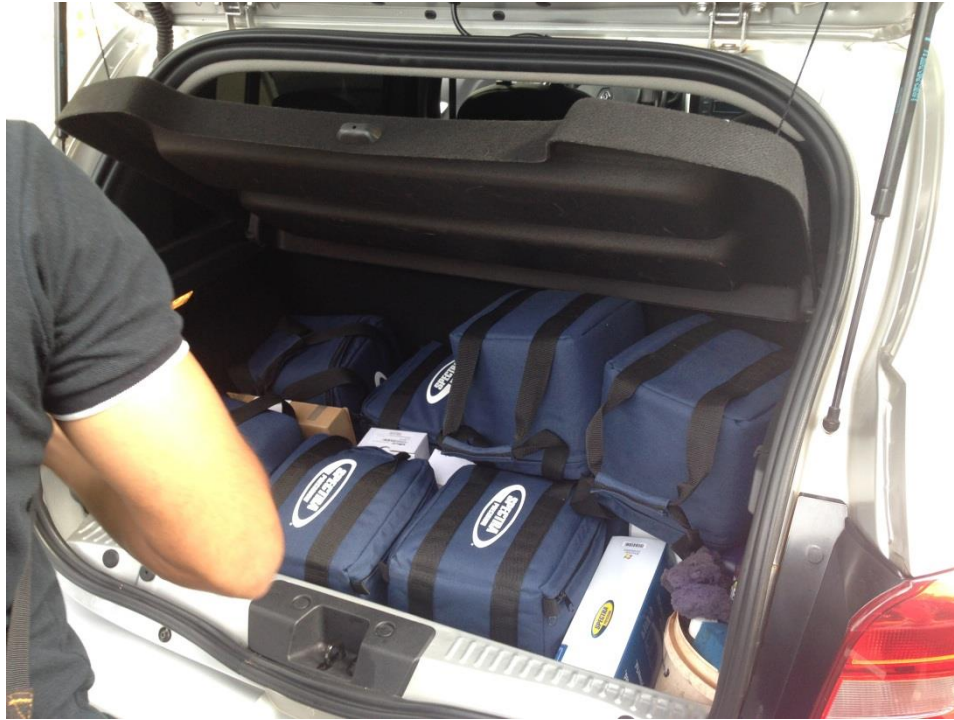
Figura 08: Equipamentos sendo colocados nos automóveis.

A equipe saiu do Ministério do Planejamento às 8:30 da manhã, em direção ao Núcleo Rural Lago Oeste. O trajeto realizado durante o dia está representado pela linha vermelha, na figura abaixo: