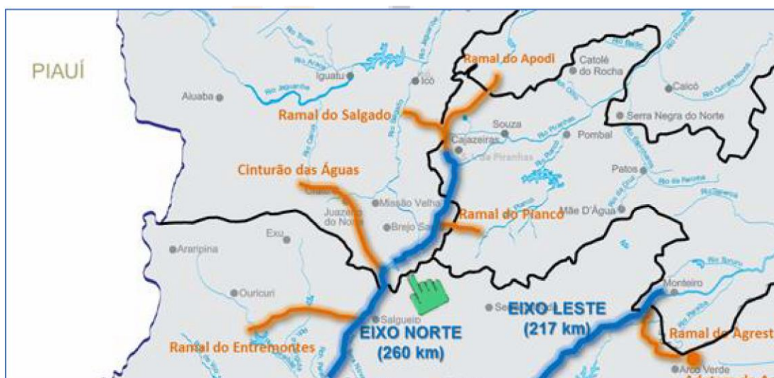
Figura 2 - Localização do trecho do canal de captação