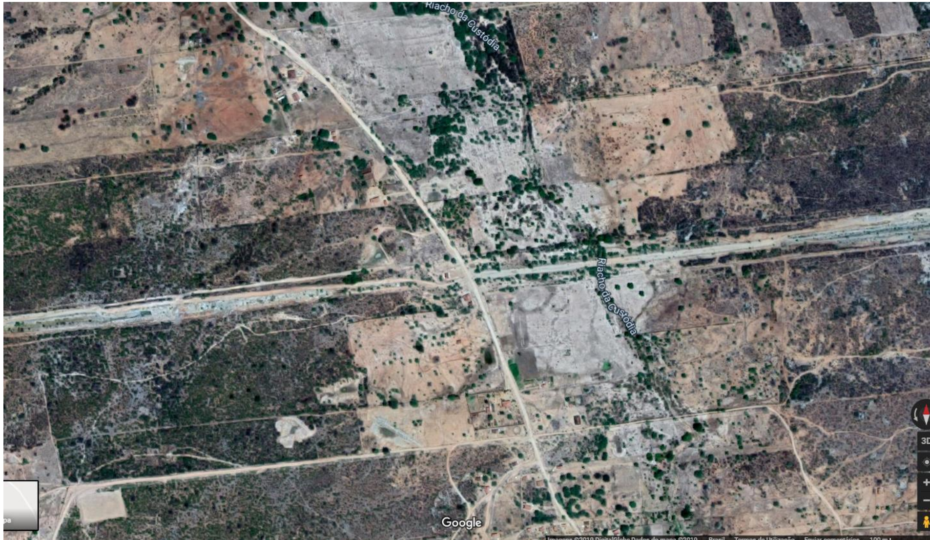
Igreja São Luiz Gonzaga, Custódia - PE (1619)