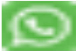
image007.png 711 B